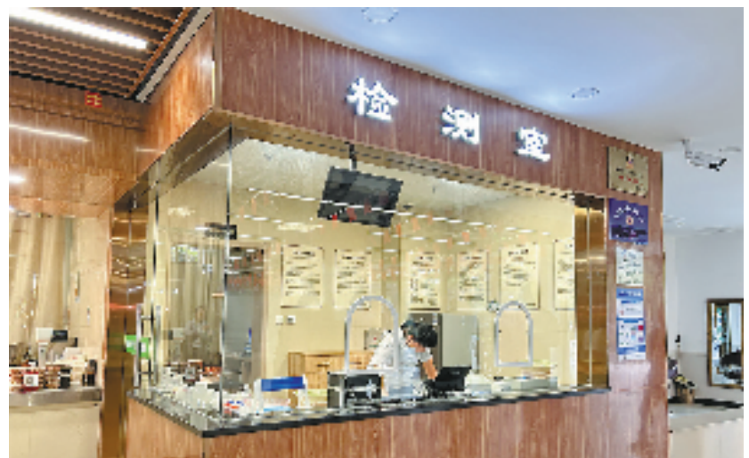
农贸市场管理人员根据《浙江省“菜篮子安全守护微改革”实施办法》开展快速检测