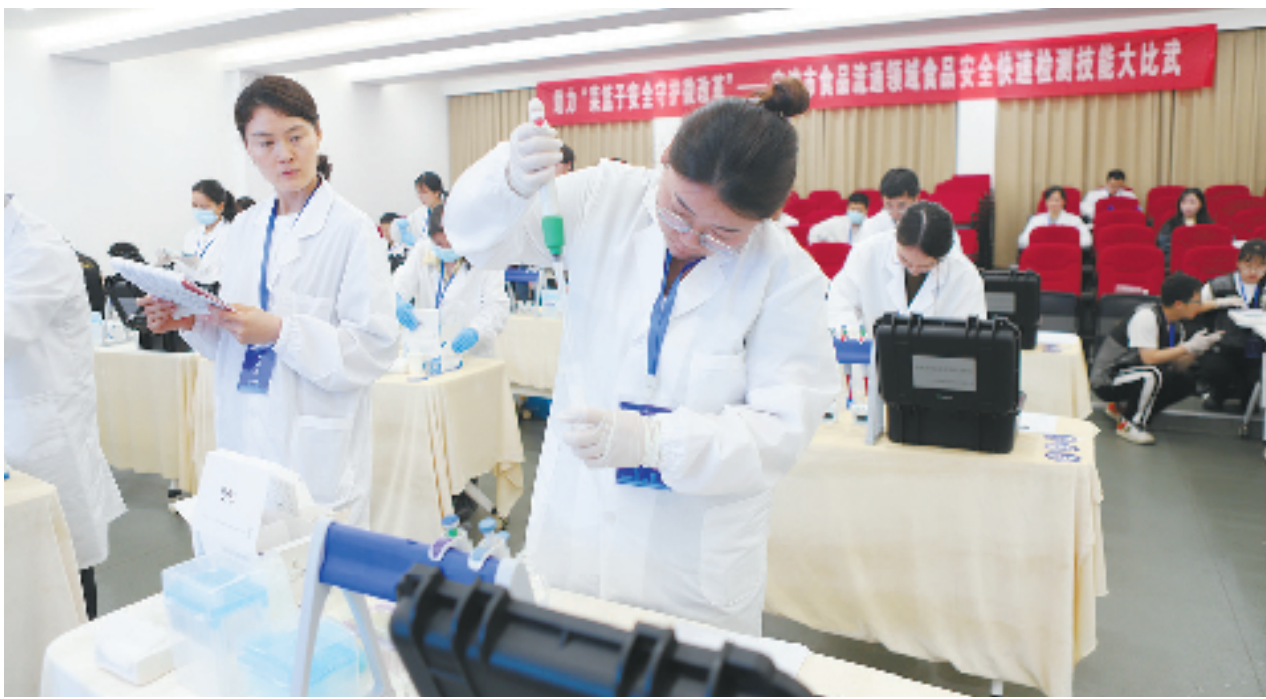
助力“菜篮子安全守护微改革”,今年5月7日下午,宁波市市场监管局举办食品流通领域食品安全快速检测技能比武活动。

浙江率先全国之先明确推出“谁快检、谁负责”原则,对市场交易食用农产品实施批批快检。同时,发挥“县级检测中心、快检车、快检箱”作用,构建法定快检“普筛”、自愿快检“补缺”和监管快检“靶向”三位一体的食品快