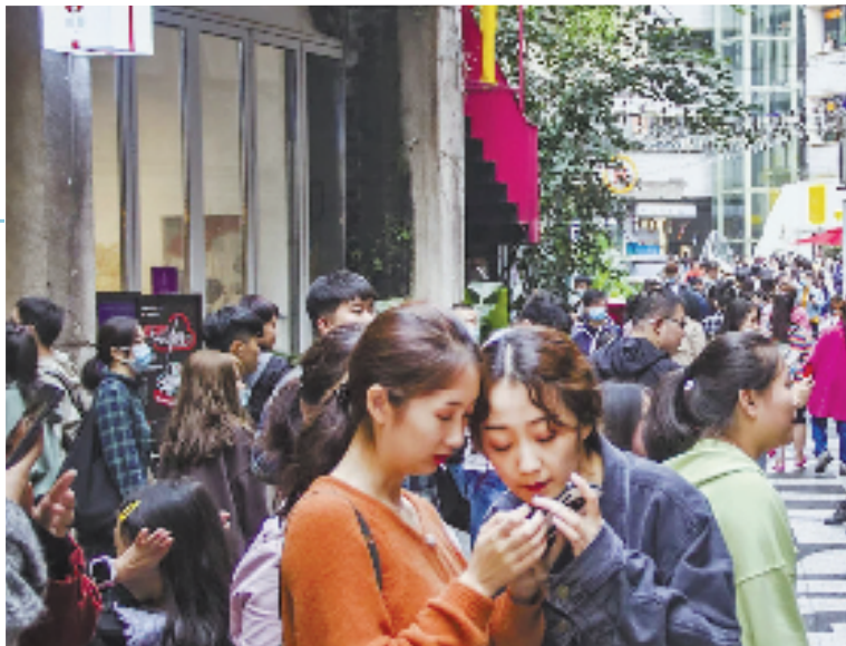
重庆二厂如今成为文旅网红打卡点,受到游客欢迎。