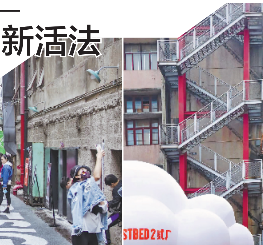
重庆二厂一角。

量的旅游资源,比如景区、度假区、旅游村等,还有一些闲置厂房、闲置场馆等也具有再利用再开发的潜能,盘活旅游资源,需要挖掘地方文化底蕴,分析市场价值,真正将游客引过来、留下来。