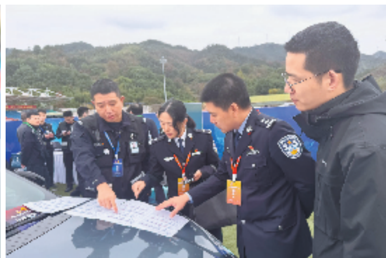
记者(右一)参与相关报告分析。