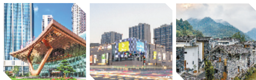
众安台州沙北未来社区实景展示

然而众安并不止步于如期交付，而是始终以客户需求为中心，通过产品力的升级，将“高品质交付”落到实处。那