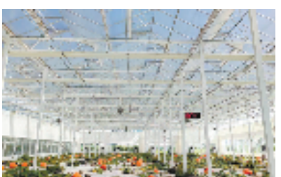
大印农场光谱选择性高端农膜

人才与农业会碰撞出怎样的火花？近日，走进嘉兴平湖市林埭镇大印农场的大棚，一排排整齐的草莓苗沐浴在阳光下，绿油油的叶子间点缀着洁白的小花朵，宛如点点繁星。大棚内的空气湿润而温暖，为草莓苗提供了理想的生长环境，每一株草莓苗都努力汲取养分，孕育着未来一颗颗红彤彤的果实。这片生机勃勃景象的背后，离不开人才的“滋养”。