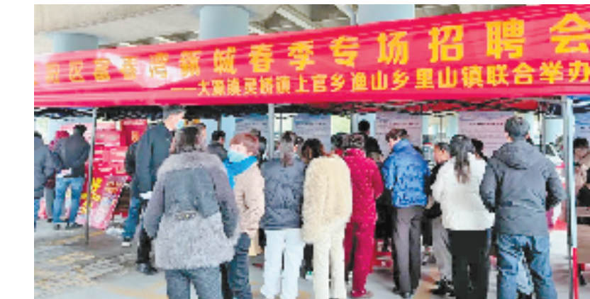
2024年富阳区富春湾新城春季专场招聘会现场

“接下来，我们将以全省重点实验室成功认定为契机，进一步强化高能级平台和人才服务保障，为人才大展拳脚提供广阔舞台。”富阳区委人才办相关负责人介绍。