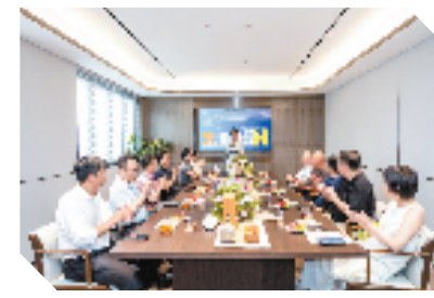
众安“客户共创”活动现场