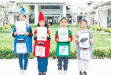
无废建设进校园

“下一步，我们将锚定‘无废城市’建设智治示范区目标，进一步发挥高新区创新优势，以数字化技术为牵引，构建固废产生强度更低、碳排放强度更低、信息反馈更具时效、管理决策更为智能、社会参与更为广泛的‘无废滨江’建设模式。”杭州市生态环境局滨江分局相关负责人说。