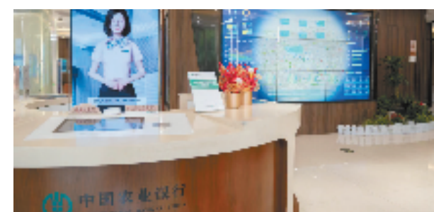
农行浙江分行不断迭代升级“5G+”智慧网点