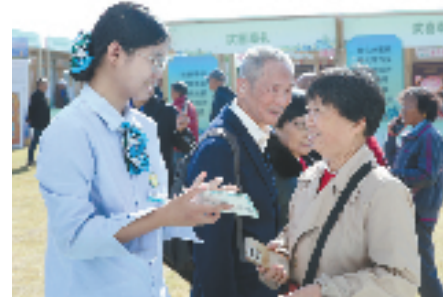
农行浙江分行工作人员向客户介绍“数字人民币消费体验券”