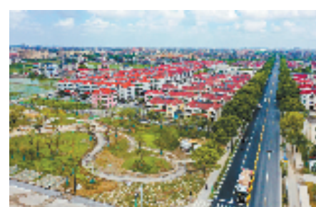
农行浙江分行金融赋能萧山梅林村未来乡村建设