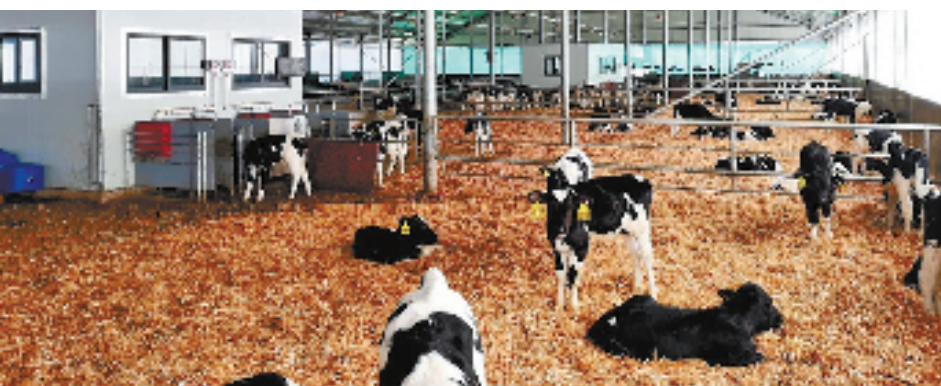
农行浙江分行金融支持畜牧业加快推进数智化建设

实体经济是高质量发展的根基和引擎。畜牧业重资产投入、回报周期长。对金融机构而言，支持畜牧业存在贷后监管难、评估难、处置难“三难”。因此，在过去，银行“能跑的不贷，有毛的不贷”。