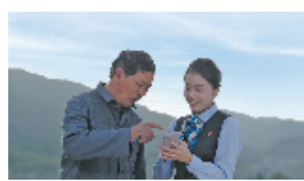
农行浙江分行客户经理指导农户线上申请“惠农e贷”