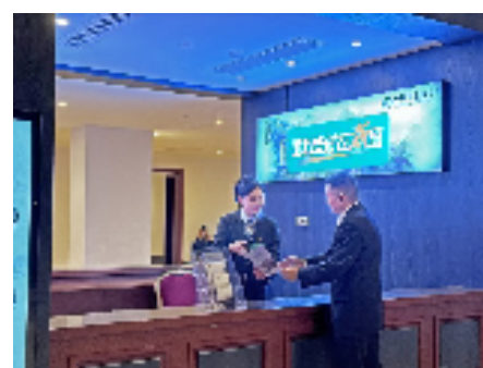
2024乌镇互联网峰会期间，农行浙江嘉兴桐乡乌镇支行在乌镇游客中心提供线上“云坐席在线服务”和线下咨询服务。