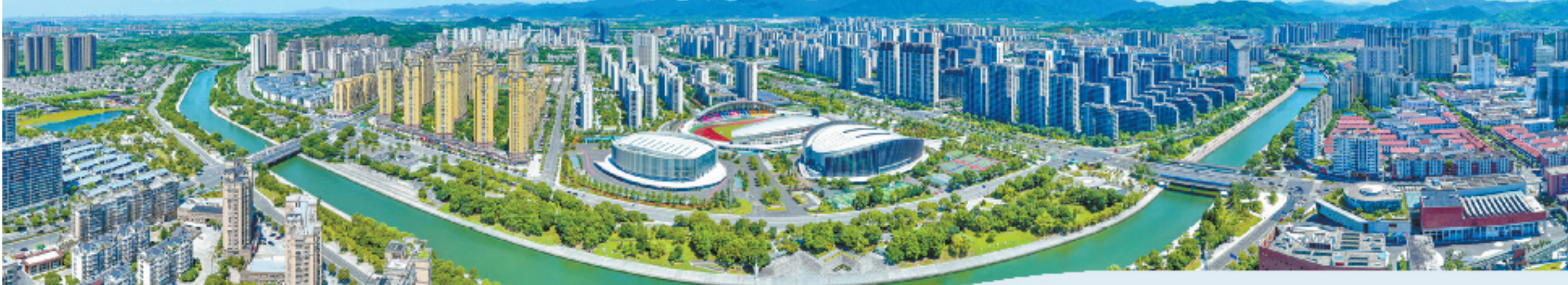
奉化城区

宁波市奉化区溪口镇的西北方向,有一座雪窦山,被誉为“海上蓬莱、陆上天台”,群峰环绕,林木葱茏。钟灵毓秀的雪窦名山,历史底蕴深厚、文旅资源优渥。近年来,奉化持续做好文旅融合文章,深入挖掘和传播“和合共生”的文化内涵,扩大雪窦名山的影响力,讲好奉化故事,擦亮城市名片。