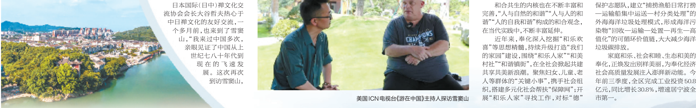
剡溪美景