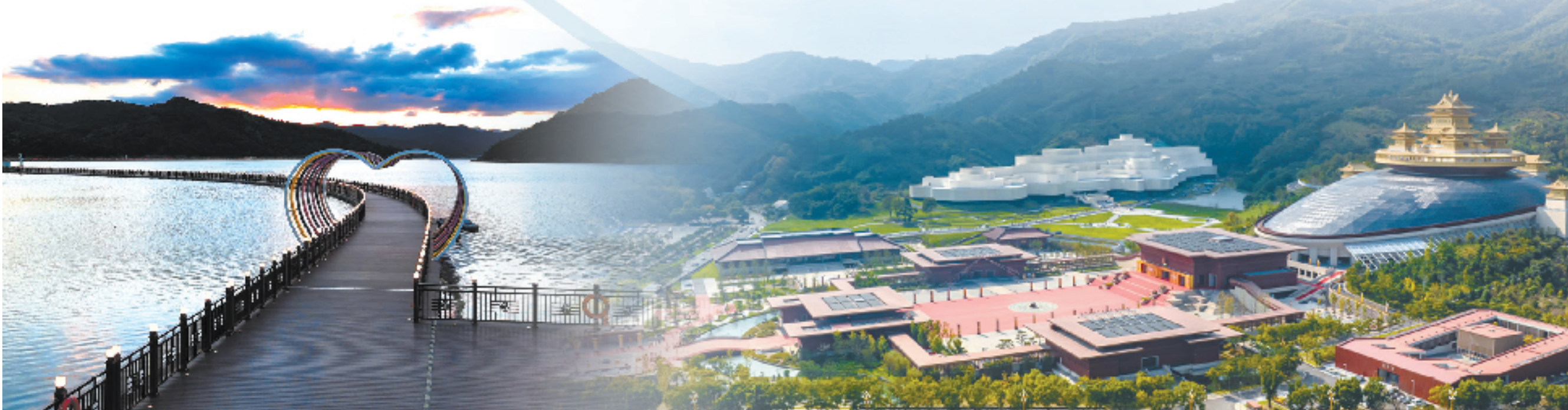
“海上最长的可行车浮桥”天妃湖福桥