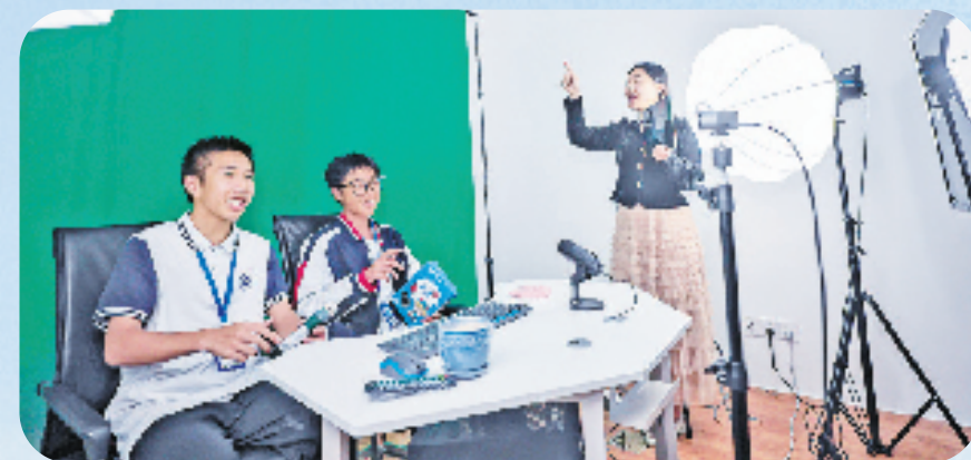
院企合作阿里云教师给直播电商专业学生上课

勇向潮头立,帆起逐浪高。安吉技师学院将以创新为翼,以卓越为航,以“功以才成,业由才广”的气魄,引领学子们在技术与智慧的海洋中乘风破浪,书写着中国职业技能教育的辉煌未来。