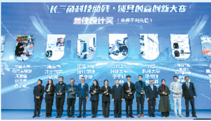
长三角科技助残·辅具创意创新大赛颁奖现场

技辅具渐渐成了残疾人生活中必不可少的工具。今年6月起,2024长三角科技助残·辅具创意创新大赛正式开启报名阶段。