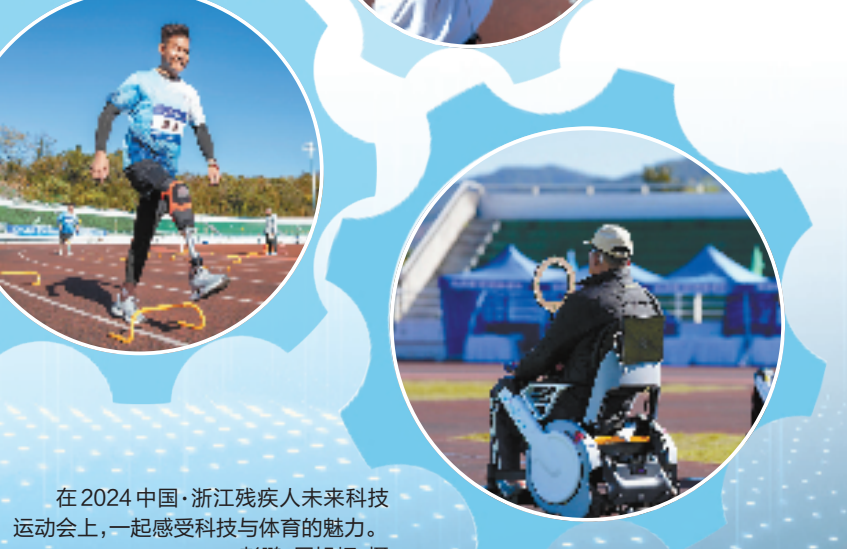
在2024中国·浙江残疾人未来科技运动会上,一起感受科技与体育的魅力。

据悉,省残联将继续深入了解掌握残疾人实际需求,探索建立科技助残供需对接机制,加强产学研用对接,助推高科技辅具产业发展,积极推进高科技助残辅具进社区、进“残疾人之家”等助残机构,不断扩大高科技辅具与技术的展示、体验、应用,持续擦亮广大残疾人美好生活底色。