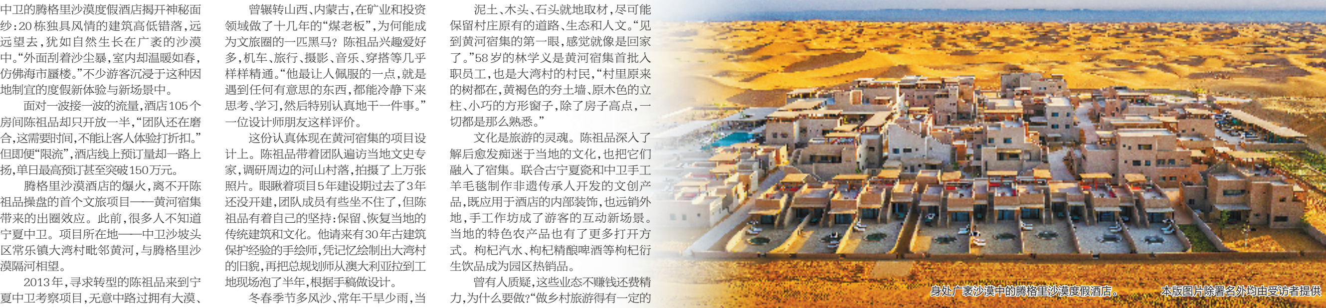
身处广袤沙漠中的腾格里沙漠度假酒店。