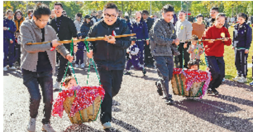
近日，余姚市迪尼幼儿园第三届阳光运动会“农耕冬藏”亲子运动会举行，大家在游戏中体验劳动的快乐、收获的喜悦。

海景社区“景邻汇心”调解室组建一支融合性高、专业性强的调解队伍，不仅引入法律服务专业力量，还汇聚了社区居委会、居民代表及物业公司的力量，形成一个紧密合作的议事团体，从源头入手，化解矛盾纠纷；东海社区聚焦“老龄化”现状，创立“邻里日”“敲门行动”“老年学堂”等各种适老服务品牌，提高老人的幸福感、获得感；海湾社区则着眼于新居民服务，联动物业、业委会三方协同共治，推动“睦邻湾”品牌三方协同共治机制走向深入。