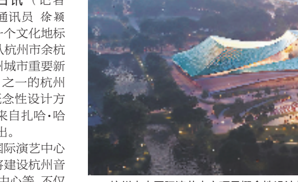
杭州未来国际演艺中心项目概念性设计效果图。

亮:建筑设计的灵感来源是丝绸,色彩用的是宋画碧青,造型则以山为形。杭州未来国际演艺中心的屋顶,犹如三片