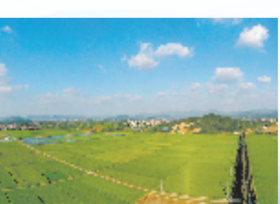
嵊州市优质稻米生产基地

同时，针对有考证需求的学员，服务中心提供个性化服务，帮助学员拿到商务部中国国际电子商务中心颁发的直播讲师能力证书，培育电商本土化人才。还多次举办短视频大赛、主播分享沙龙、表彰大会等活动，充分调动了村民参与直播卖货的积极性。