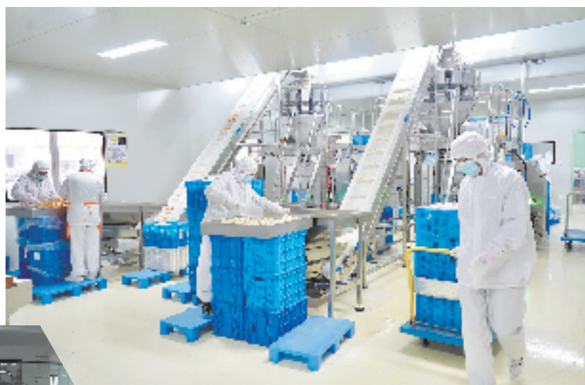
嵊州市小笼包装车间

县级物流配送中心、乡镇快递网点数字化改造，完善智慧仓储、自动分拣、射频识别、新能源配送车等设施，提升村级配送效率。