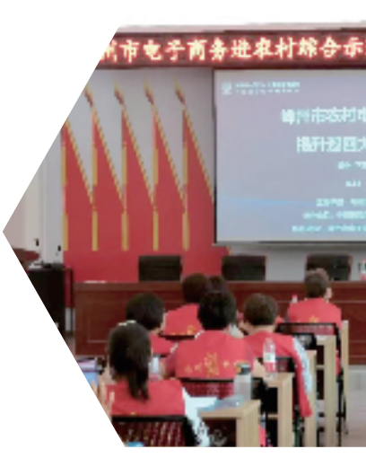
嵊州市农村电商能力提升巡回大讲堂

建新模式。与嵊州市妇联、下王镇组织开展嵊州市村嫂电商直播训练营和嵊州市下王镇“巾帼共富工坊”村嫂赋能班。线上线下赋能，帮助村嫂就业致富。