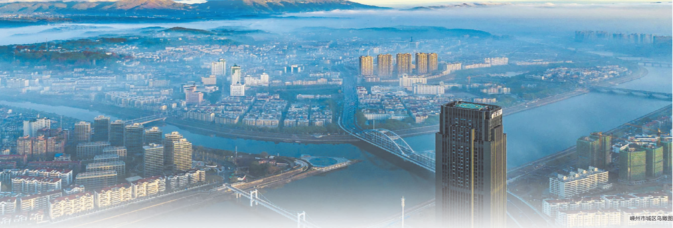
嵊州市城区鸟瞰图

2022年嵊州网络零售额已达243.48亿元，其中农产品网络零售额同比增长57%；累计创建淘宝镇3个、电商专业村15个；嵊州市电子商务公共服务中心获省商务厅2022年度市、县电子商务公共服务中心考核优秀单位，并获得绍兴市三星级“共富工坊”称号；汇通达——汇心向农直播“共富工坊”入选省级首批百家电商直播式“共富工坊”典型案例；金天得电商产业园“共富工坊”入选全省第二批电商直播式“共富工坊”典型案例……这些亮眼的成绩是嵊州在电商助农产业交出的一份高分答卷，也成为未来继续砥砺前行力量源泉。