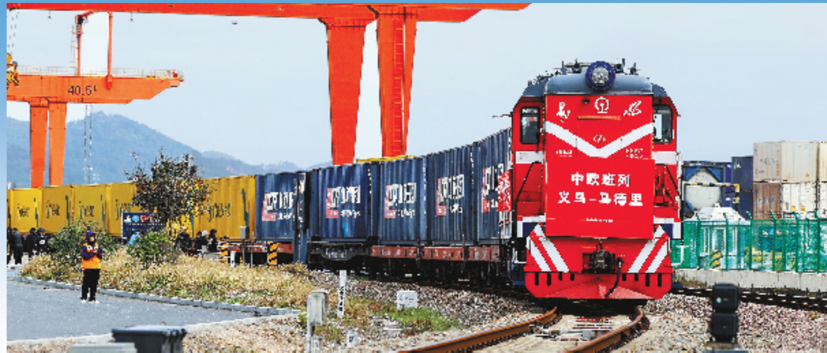
11月18日上午,铁路义乌西站,一列满载出口货物的中欧班列驶往西班牙马德里。

通达世界。“义新欧”中欧班列不仅是物流通道,更是“一带一路”合作共赢样本。目前,“义新欧”中欧班列已建成马德里、杜伊斯堡、马拉舍维奇、莫斯科、喀什5个物流分拨中心,投用杜伊斯堡集散中心,与中铁欧洲公司、德铁欧亚货运有限公司签订战略合作协议,开展中欧班列集装箱调度中心建设。境外服务网络从无到有,织成网,实现班列运输从“点对点”到“枢纽对枢纽”的转变。