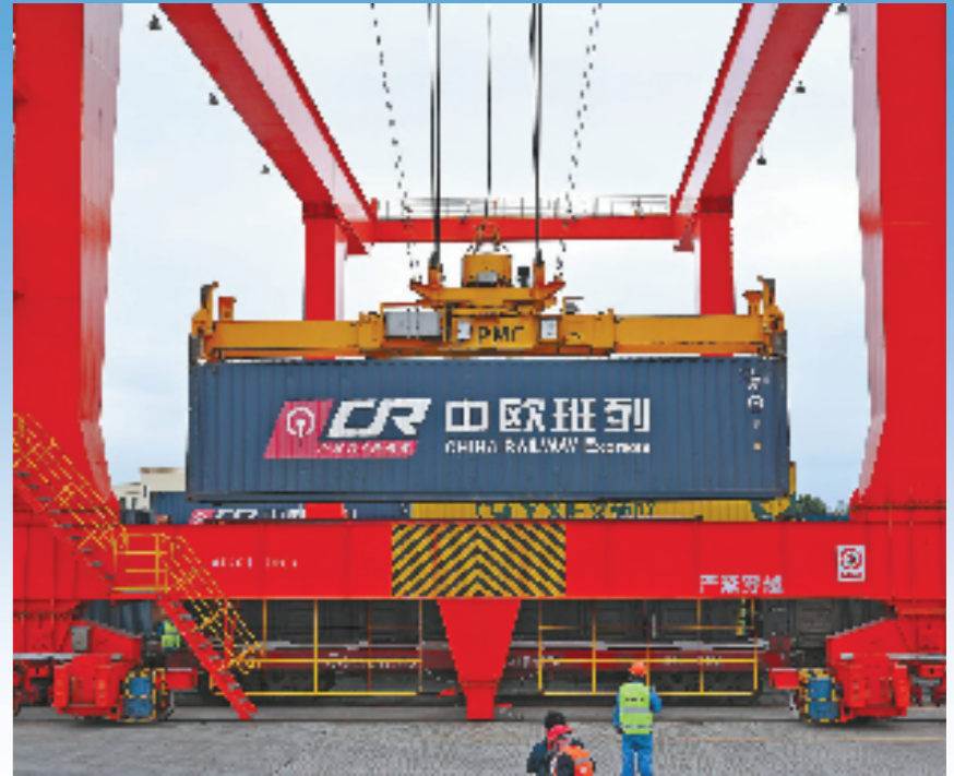
11月18日上午,铁路义乌西站,中欧班列即将启程,图为吊装集装箱现场。