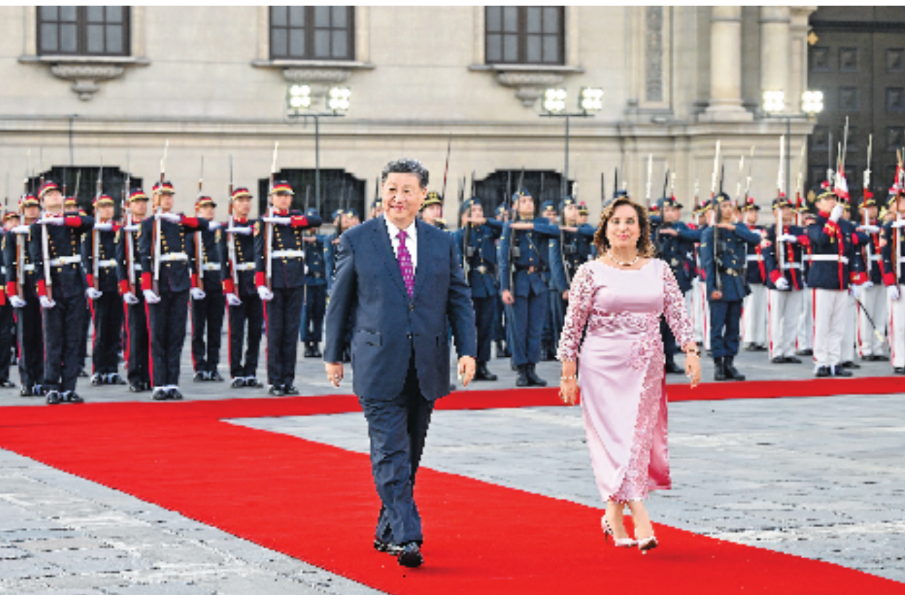
当地时间11月14日下午,国家主席习近平在利马总统府同秘鲁总统博鲁阿尔特举行会谈。博鲁阿尔特在总统府前广场为习近平举行隆重盛大欢迎仪式。

新华社利马11月14日电(记者倪四义 郝薇薇)当地时间11月14日下午,国家主席习近平在利马总统府同秘鲁总统博鲁阿尔特举行会谈。