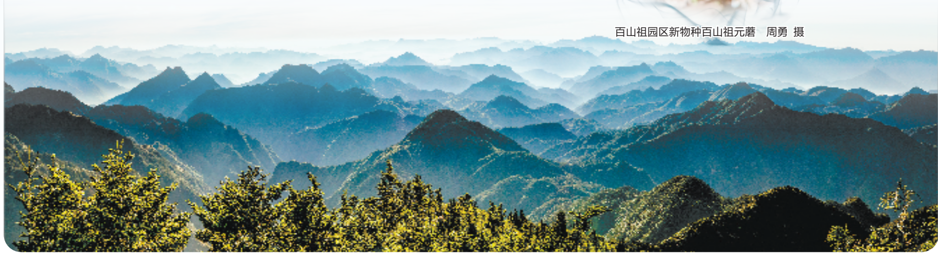
万里山峦