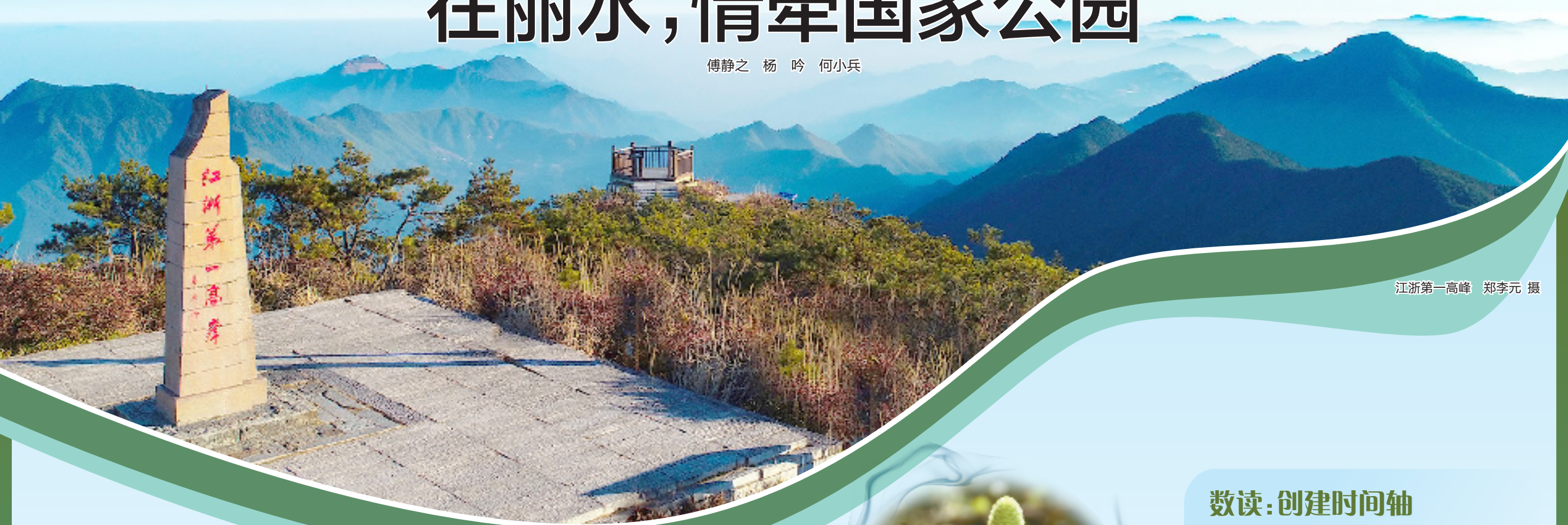
江浙第一高峰

在繁华富庶的浙江，除了平原和滨海，还有一片原始秘境同样令人迷醉。这里，是瓯江和闽江的源头；这里，有保护完好的中亚热带常绿阔叶林，也是百山祖冷杉、白颈长尾雉、黑麂等中国珍稀濒危物种的“基因保护地”。