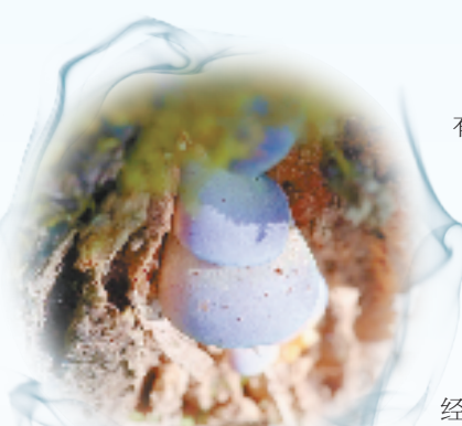
百山祖园区新物种百山祖元蘑

有浙江特色的国家公园创建之路越发明晰，也为经济发达、人口密集、集体林占比高的地方推进以国家公园为主体的自然保护地体系建设，打磨出可复制、可推广的浙江经验。