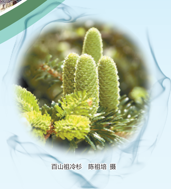
百山祖冷杉

以成功创建国家公园为契机，丽水正建立以国家公园为主体的自然保护地体系，定期开展生物多样性调查，推进县域野生动植物资源本底调查。