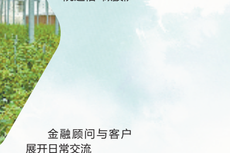
金融顾问与客户展开日常交流