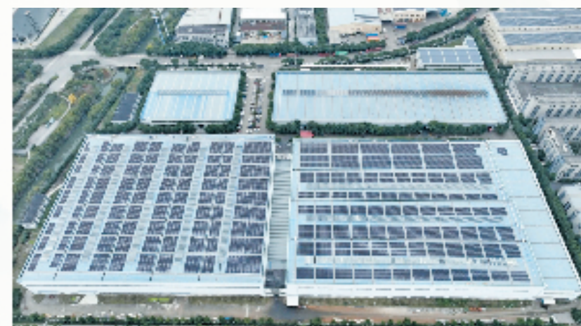
浙商银行“缙商贷”助力光伏企业发展

如今,绿色正成为浙江高质量发展的重要底色。浙商银行执金融为笔,于沃野千里,继续绘写丰收的喜悦。