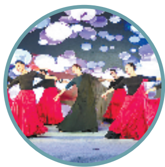
新塘街道三团三社舞蹈队节目《往事只能回味》

据统计，截至今年10月，新塘街道已开展“百姓百艺”全民艺术普及、区级配送文化培训课程共计84课时；“文化管家”村社覆盖课程共计412课时，服务群众超1.2万人次；已累计完成文艺赋能有效场次125场次；开展“一镇一品”儿童美育、文化走亲、非遗、全民阅读等系列活动共计74场次，服务群众超1.4万人次。