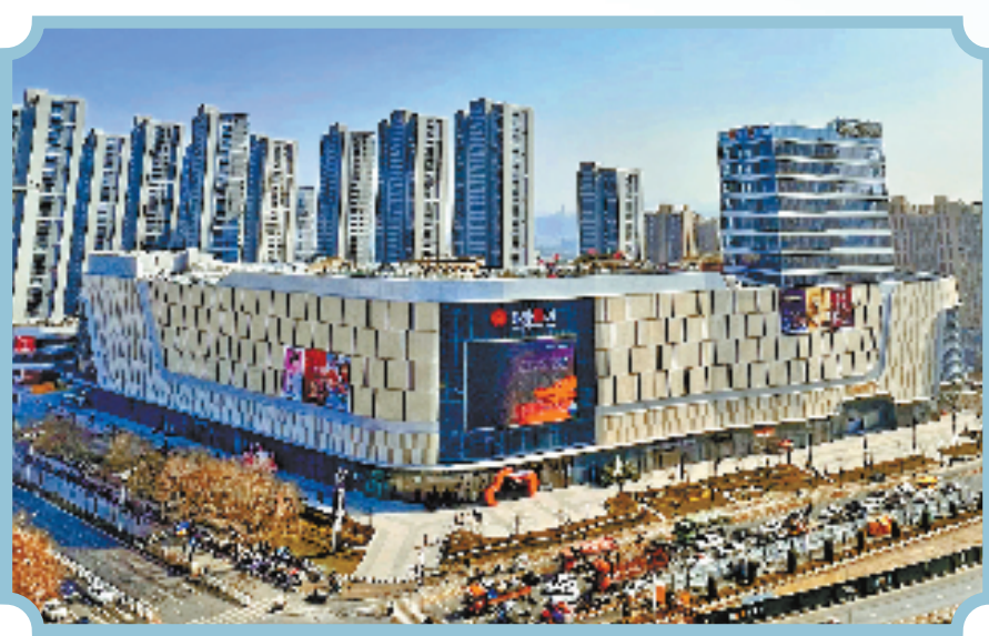
杭州萧山银泰百货(新塘)

沿着通城高架往杭州东南方向驱车，一个半城半乡的活力之都映入眼帘。杭州市萧山区新塘街道，素有“中国羽绒之都”的美誉，这里聚集了高速、高架、高铁、地铁等交通资源，区位优势明显，是杭州四通八达的交通运输枢纽；这里有新青年的青春飞扬和老底子的人文烟火气，大量的人口集聚和人才聚集为产业的发展提供了坚实的人力资源基础……新塘街道以产兴城、以城聚人、以人兴业，奏响产城人融合发展的时代序曲，有力推动物质富足与精神富有的良性互动，构筑宜居宜业宜游的乐活人居理想地。