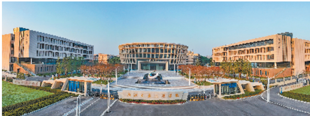
浙江交通技师学院新大门与新大楼落成，以崭新面貌开启学院发展新篇。

厚德精艺五十载，健行致远谱华章。11月9日，浙江交通技师学院将迎来它辉煌的五十华诞。学校从初创时的174名学生到如今的全省首个万人技师学院，不仅见证了职业教育的蓬勃发展，更以独特的办学理念和卓越的教学成果，成为我省交通行业高技能人才的摇篮。今天，站在新的历史起点上，回望来时路，展望新征程，浙江交通技师学院正以崭新的姿态，驶入高质量发展快车道。