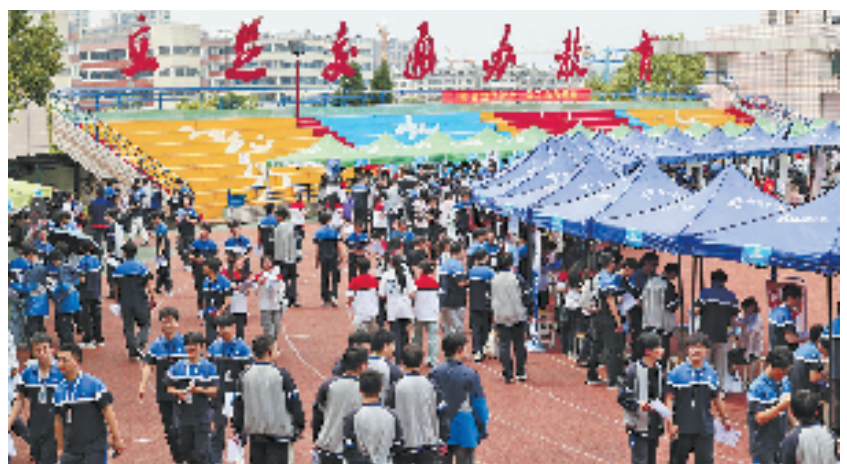
浙江交通技师学院毕业生双选会上，“立足交通办教育”七个大字赫然醒目。

此外，学校还与福建松溪、贵州瓮安、云南曲靖、浙江庆元等地职业院校进行结对帮扶，为相关院校提供教育培训、专业建设、技能竞赛等多方面指导，帮助多家学校实现了提升发展，在东西部协作等国家战略中彰显担当。“溯源从之，道阻且长”，职业教育的“发展任重而道远”。在未来的征程中，浙江交通技师学院将继续秉承“厚德精艺、健行致远”的校训精神，坚持特色发展、内涵发展、创新发展，书写更加辉煌的新篇章。