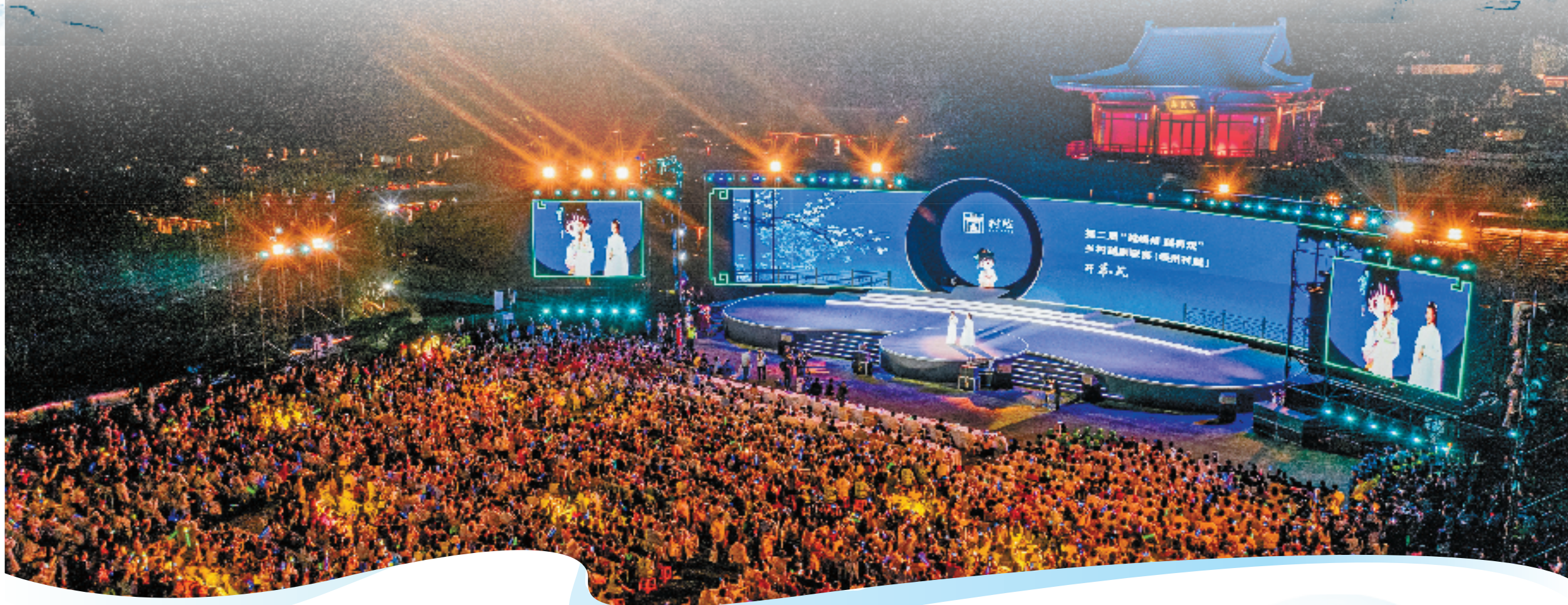
“嵊州村越”开幕式现场