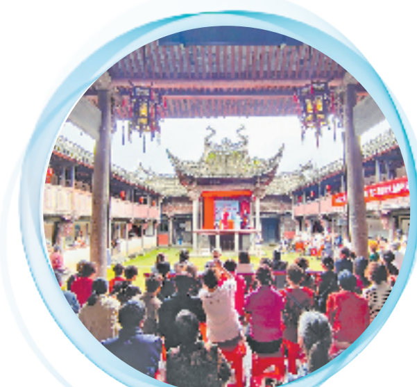
在崇仁古镇玉山公祠古戏台，戏迷唱越剧，吸引了不少村民围观看戏。