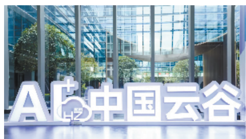
中国云谷闪亮登场

拥抱AI，共创未来。产业向“新”向“质”不断聚集，为构建数字中国贡献力量，在紫金港科技城，一个具有国际竞争力的智算云产业活力港即将崛起，让我们拭目以待。