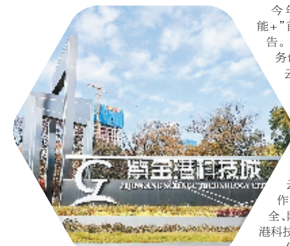
中国云谷先导区——紫金港科技城