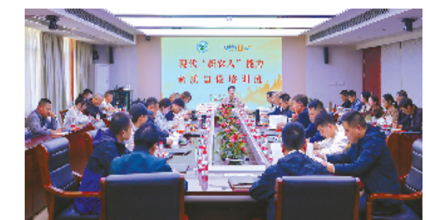
白石镇与浙江理工大学共同举办第二期现代“新农人”能力素质建设培训班

“乡村振兴，关键在人。把具有一技之长、对乡村全面振兴作出一定贡献的‘土专家’‘田秀才’‘乡创客’选拔、培养起来，才能带领传承技艺、带强产业发展、带动群众致富。”白石镇党委书记金童说。