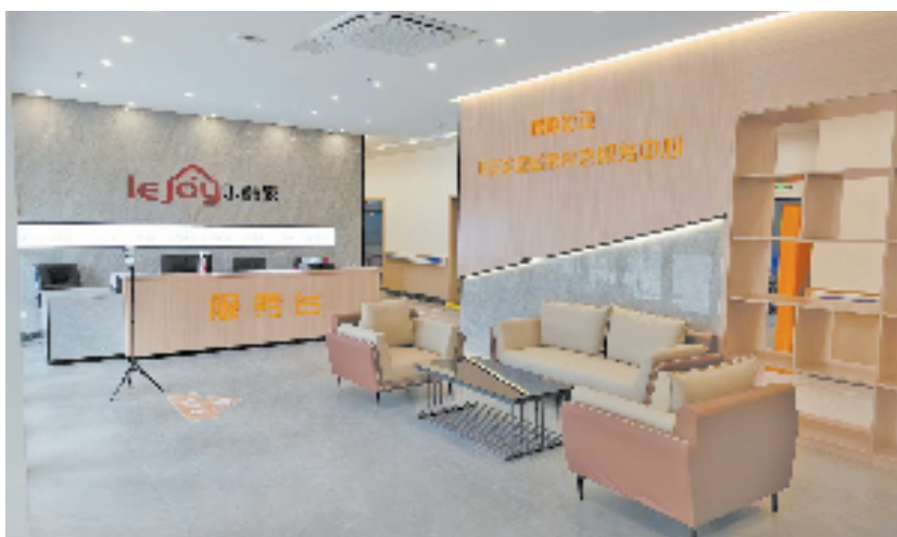
乐龄家在温岭市横峰街道建设的社区养老服务中心