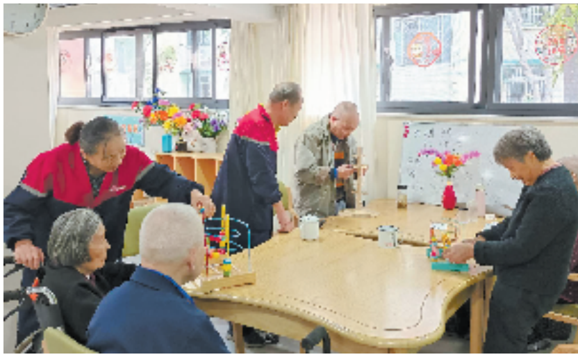
乐龄家养老中心护理人员辅导老人做手指训练

为了实现机构与社区养老的协调共建和融合发展,乐龄家大力推进嵌入式“机构—社区—居家养老”复合型