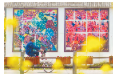
余东村农民画

德清县莫干山镇的高峰村是国家级生态村,近年来,高峰村探索出一套强村志、强村产业、强村指数、强村论