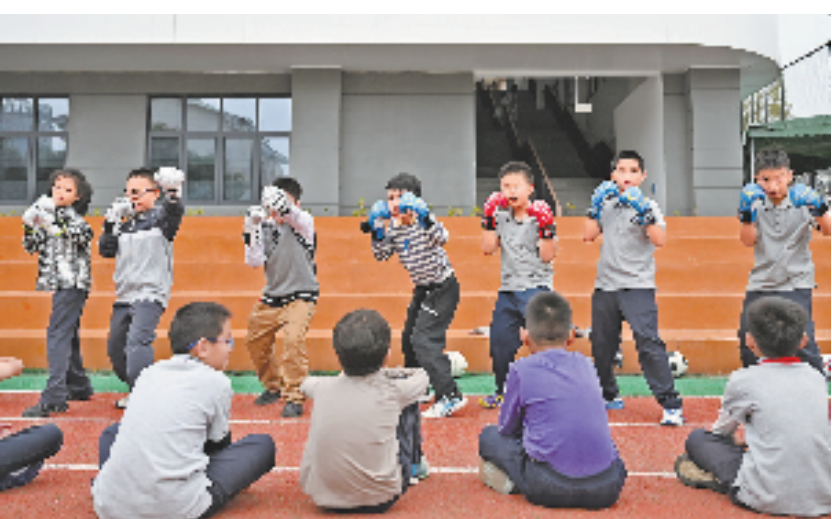
10月30日,丽水市莲都区大洋路小学教育集团操场上,孩子们正在参与丰富多彩的课间活动。2018年开始,大洋路小学教育集团着力打造幸福课间,让孩子们走出教室,走向各个空间,解放学生的头脑、手脚、空间感,让课间生活充满活力。图为学生们在练习拳击。

“今年以来,研究院依托自身平台优势,为山茶油企业免费提供各项技术咨询126次、化验员培训28人次,减免费用100余万元。”常山县市场监管局党委委员何红良介绍,接下来,研究院将设立省山茶油质检中心,并以企业标准“领跑者”评估为契机,挖掘企业产品先进指标,进一步规范行业技术标准,争创国家油茶产业质检中心,推动本地油茶产业高质量发展。