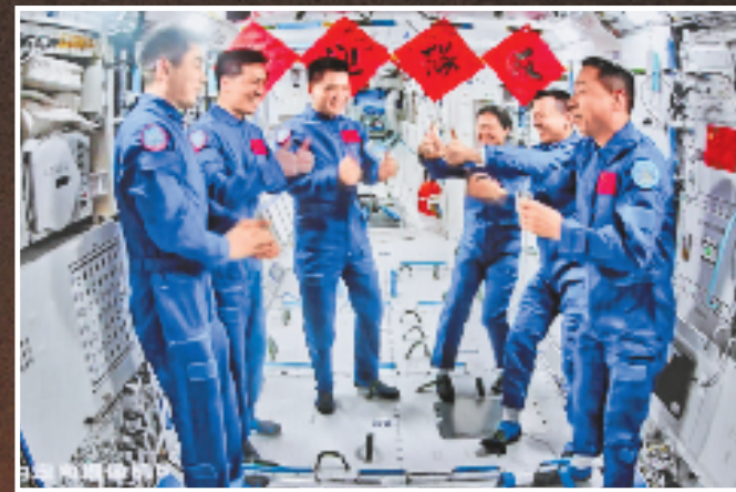
10月30日在北京航天飞行控制中心拍摄的神舟十九号航天员乘组和神舟十八号航天员乘组交流的画面。