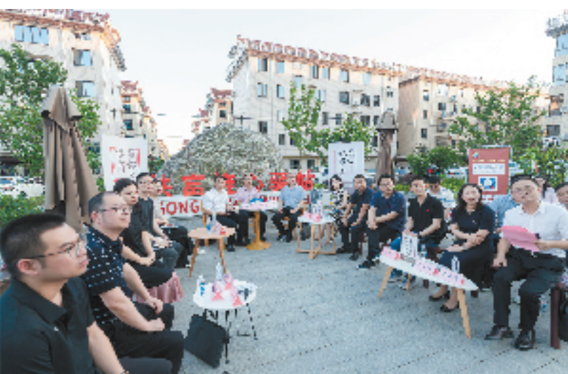
7月4日,宁波市海曙街道利民村广场上,宁波市政协委员与人才代表、企业及相关部门负责人,围绕“探索人才公寓乡村新模式,助力强村富民惠企留才”开展民生议事堂协商。

在大局中找题,在协商中监督,在监督中落实。8月至10月,浙江政协坚持协商式监督特色,围绕2024年度民生实事项目实施情况,市政协持续开展线下调研,实地察看120余个项目点位,对发现问题进行“点对点”协商沟通,督促牵头部门加快推进,帮助协调解决要素保障、政策处理等问题,确保项目顺利进行。丽水市政协咬定关键问题不放松,以“督帮一体”的方式对新改扩建村卫生室等事关群众切身利益的项目进行全覆盖检查,尤其是对师生同菜同质同价等事项坚持每年“回头看”。 各级政协还积极探索政协民主监督同党内监督、舆论监督等贯通协同的有效路径,进一步汇聚监督合力。省政协会同省纪委监委,出台推进省政协民主监督与省纪委监委专责监督贯通协同的办法,制定实施任务分工方案,有力推动政协、纪委监委监督联动互促。在舟山,市政协和市纪委监委积极回应,推进“民主监督+专责监督”