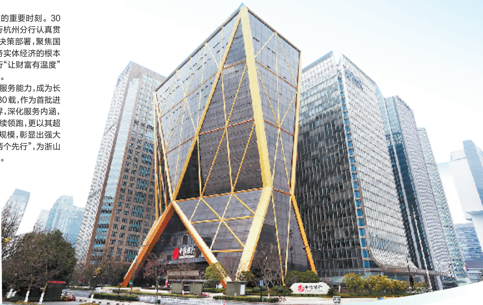
中信银行杭州分行大楼

中信银行杭州分行自1994年成立以来,便以卓越的服务能力,成为长三角南翼经济区金融版图上的璀璨明珠。栉风沐雨30载,作为首批进驻浙江省的股份制银行省级分行,该行不断拓宽服务边界,深化服务内涵,不仅在综合金融服务能力、资产质量、监管评级等方面持续领跑,更以其超12000亿元的综合融资规模和均超5000亿元的存贷款规模,彰显出强大的影响力和综合实力。在高质量发展中奋力助推浙江“两个先行”,为浙山浙水精心浇灌“金融活水”,打造了深刻的“中信金融范式”。