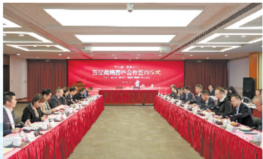
中信银行杭州分行举行五星高价值成长客户战略合作签约,为企业提供全生命周期的综合服务方案。

该行充分发挥“金融+实业”“投行+商行”“境内+境外”的综合金融优势,千方百计在增融资总量上下功夫,多渠道加大资金投入。每年对民企新发放贷款1000亿元以上,通过债券、股权等提供综合融资投放超2000亿元。尤其是该行以“中信系”协同创新为抓手,向优质民企提供资本市场融资支持,近三年“中信系”券商助推浙江民企上市超30家,融资351亿元;定向增发12家,融资258亿元。