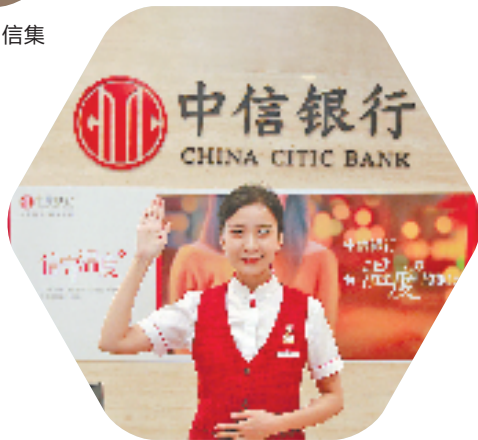
中信银行杭州分行员工服务招手礼