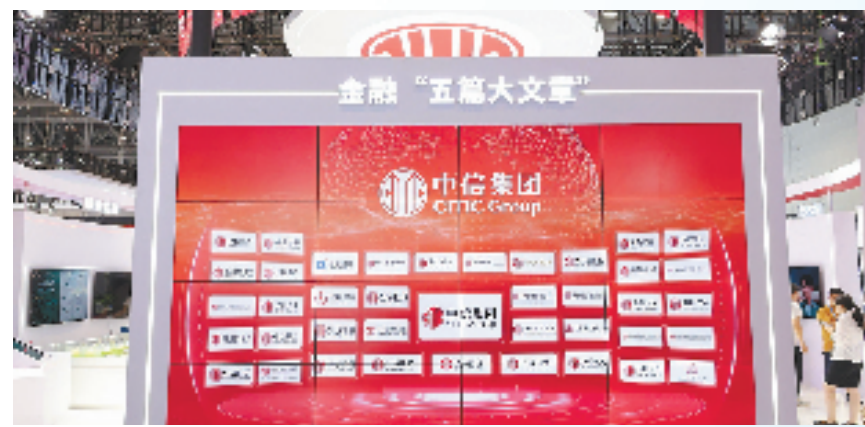
中信集团旗下五大板块发挥协同优势,做实做优金融“五篇大文章”。

在服务数字民生方面,该行依托“中信银行浙江信e通”微信公众号,为超250万个人客户提供医保社保查询、日常生活缴费、新市民政策咨询、普惠贷款申请等一系列便民增值服务。同时,经过多年发展,该行推出了智慧校园云平台、智慧医院、案款综合管理、教培监管平台等20多项数字政务产品,提升用户的获得感和幸福感。