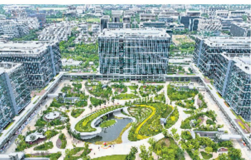
今年启用的阿里巴巴杭州全球总部新园区。

记者了解到,浙江不断健全完善政府部门与民营企业常态化沟通交流机制,建立服务清单,开展专项调研,组织线上社群,面对面听取企业意见建议,相信这样的“双向奔赴”将为浙江民营经济发展带来新的活力。