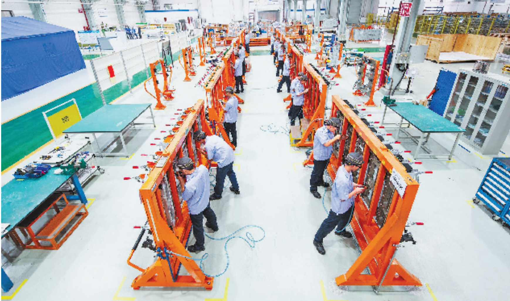
西子联合控股有限公司连续21年上榜“500强”榜单。图为西子势必锐航空制造中心的空客A320起落架舱装配线。

浙江省民营经济国际合作商会秘书长阎淳指出,全球供应链进入大重组阶段,浙江民营企业正积极主动融入这一调整进程,走出去的步伐更大,践行“地瓜经济”的意愿更强,民企国际化正从“中国制造,走向世界”走向“中国创造,全球制造”。