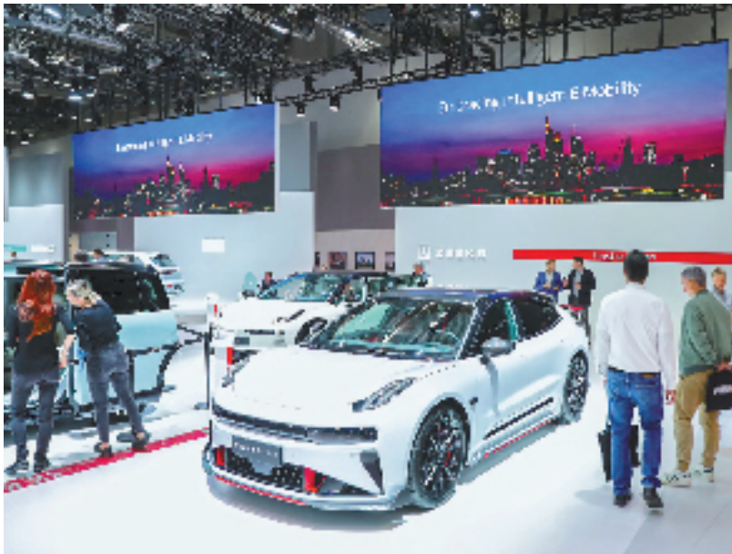
9月11日,人们在德国法兰克福国际汽车零部件及售后服务展览会上参观吉利展台。