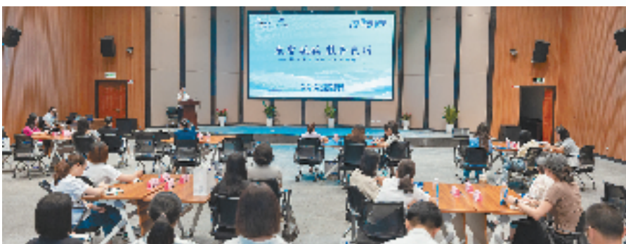
增值服务体验活动

以政务增值化改革推动营商环境优化，是进一步激荡经济活水，助力高质量发展的重要路径。