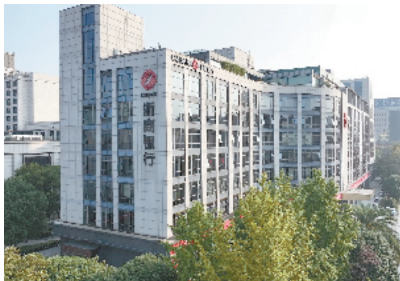
浙商银行杭州分行大楼