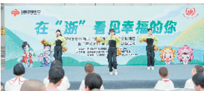
2024年浙江福彩“走进福彩公益金资助项目”温州站活动

迈入“十四五”,浙江福彩开启高质量发展新征程,2021年至2023年,销售各类福利彩票共计404.4亿元,筹