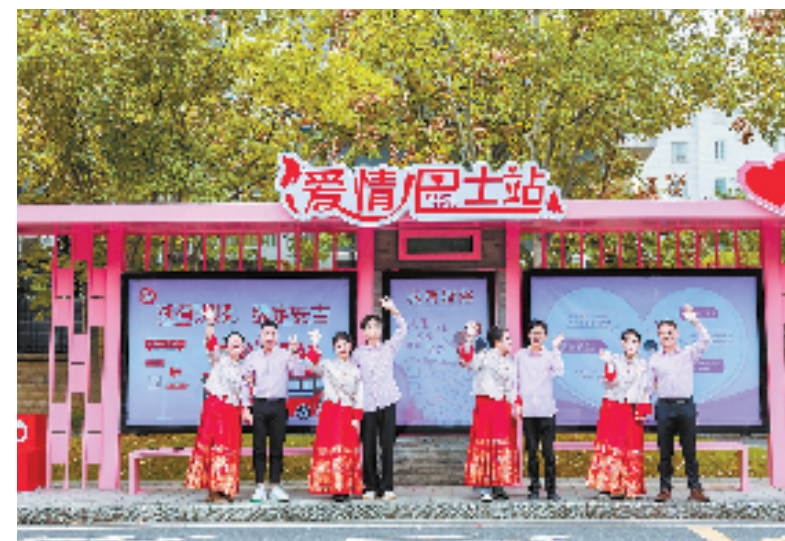
10月20日,安吉县举办青年集体婚礼。

“下一步,我们将进一步丰富婚姻登记处的活动内容,通过举办多样化的婚俗主题活动,如婚恋讲座、情感咨询等,满足不同家庭的需求,同时,我们也将加强与社区、企业的合作,共同打造一个全方位的婚姻家庭服务平台,让每一位来到安吉的青年都能更快找到属于自己的幸福。”安吉县民政局相关工作人员说。展望未来,安吉县民政局将继续提升服务质量,不断探索和创新服务模式,努力为安吉县的青年人才营造一个温馨、和谐的婚姻环境。