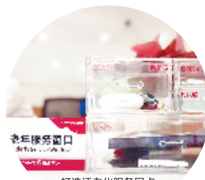
打造适老化服务网点

对善本金融的探索,永远在路上。下一步,浙商银行杭州分行将继续秉承“善本金融”理念,不断创新金融产品、优化金融服务,做好“五篇大文章”,为企业发展提供更优质的金融服务,为浙江高质量发展贡献更多金融力量。