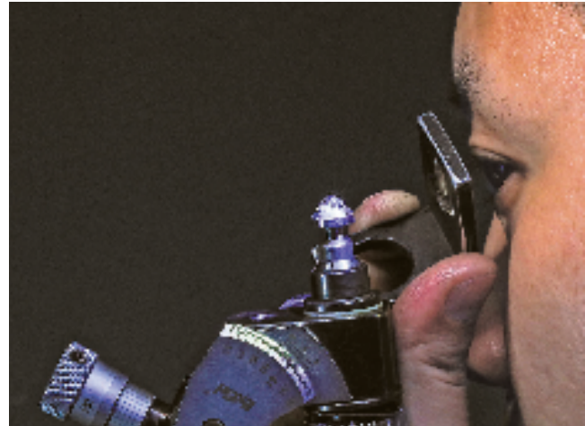
工作人员在精细打磨“生命钻石”。