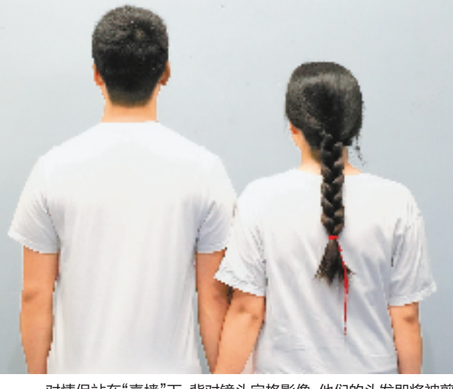
一对情侣站在“喜墙”下,背对镜头定格影像,他们的头发即将被剪下,作为制作钻戒的原材料。