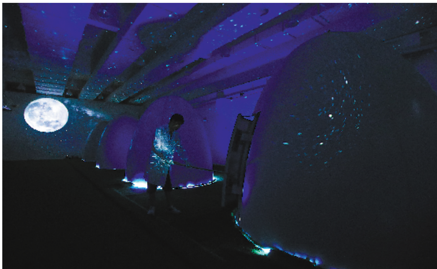
在模拟天然钻石生长环境的“生命钻石”孵化车间,工作人员把培育块放进蛋形炉内培育。