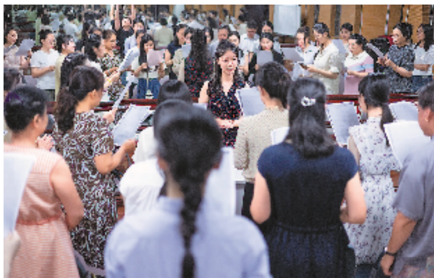
在省文化馆,来自浙江小百花越剧院的演员正在给学员讲授表演课,半数以上学员是90后。