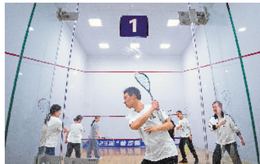
傍晚的杭州黄龙体育中心训练馆内,年轻人正在上壁球课。