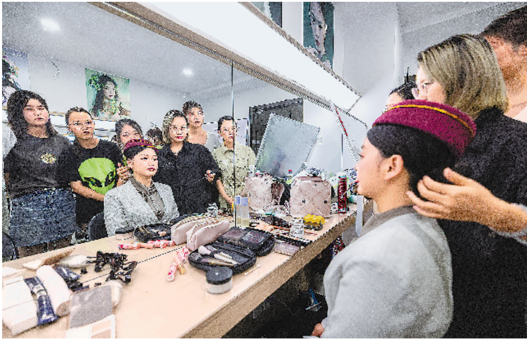
年轻人在湖州一所夜校的合作美妆机构内学习化妆。