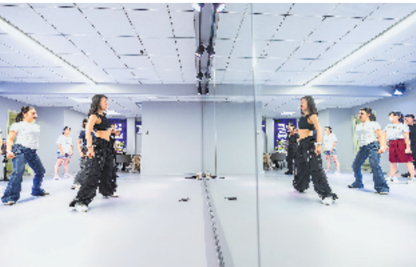
在夜校舞室,镜子里的青年人身上散发出独特魅力。

夜幕降临,城市的霓虹灯开始闪烁,在浙江,越来越多的年轻人走进夜校的教室,开始了另一种充实自我的方式。与上世纪以补习文化知识为主不同,如今的夜校称得上是“年轻人的少年宫”。