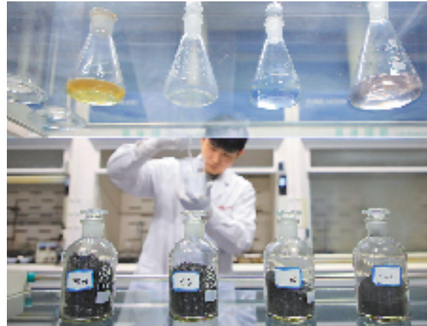
修剪后的头发经过几轮高度提纯后,变成高纯度碳源。