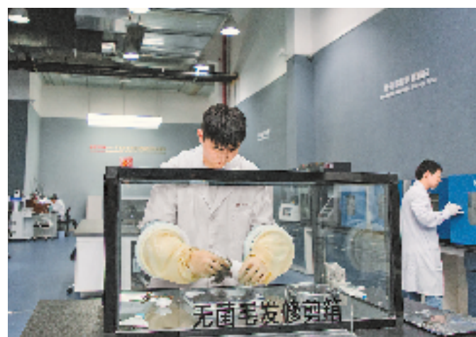
工作人员在修剪清洗干净的头发。