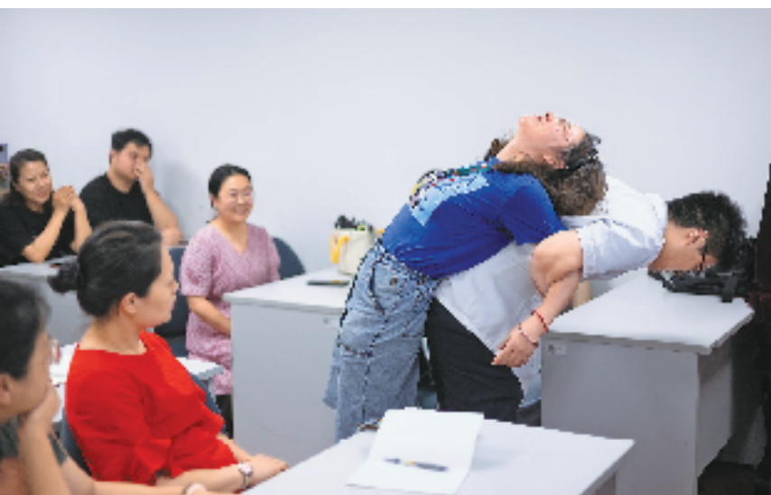
在省文化馆推出的中医推拿课程上,医生正在演示传统推拿正骨手法。