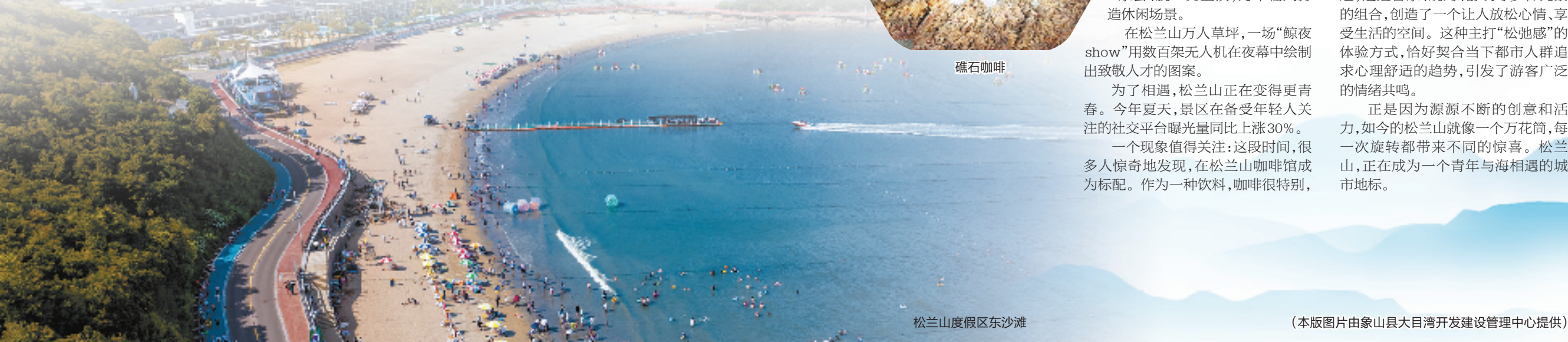
松兰山度假区东沙滩

正是因为源源不断的创意和活力,如今的松兰山就像一个万花筒,每一次旋转都带来不同的惊喜。松兰山,正在成为一个青年与海相遇的城市地标。