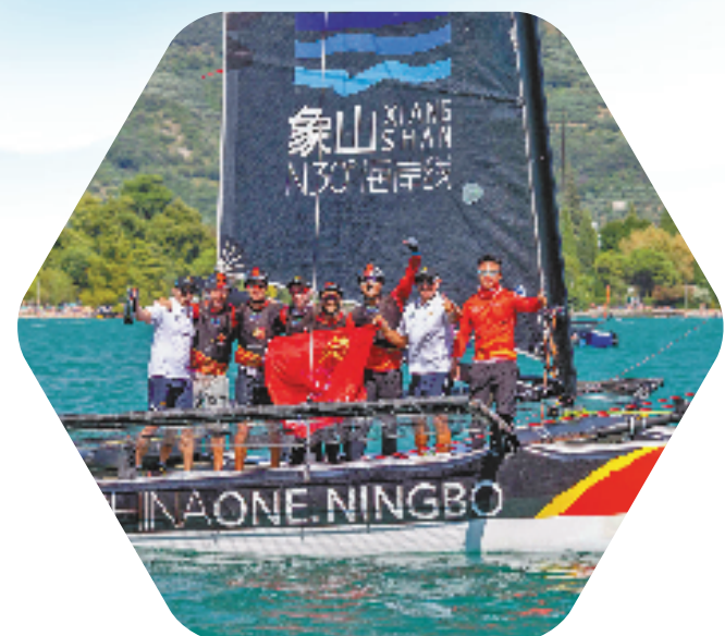
落户象山亚帆中心的中国一号帆船队