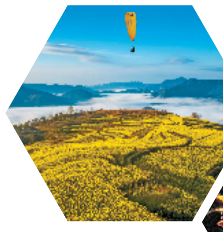
枫林镇兑样村滑翔伞赏油菜花海

在桐乡崇福,每天的幸福生活从“美”开始具象化。崇福实验小学的新校区投入使用,大型报告厅、室内风雨操场、舞蹈房、音乐小剧场、劳动专用教室等一应俱全,还高标准配套建设了“城市书房”,打