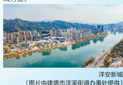
洋安新城

引领,做好土地资源高效利用文章。切实推动区域高质量发展,为建德市奋力打造“幸福宜居文旅共富”新图景贡献新力量。