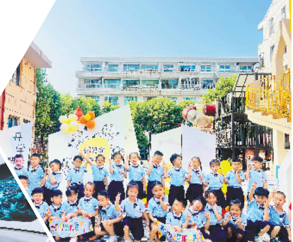
平阳加强普惠性幼儿园建设,推进学前教育高质量发展。图为鳌江镇中心幼儿园育英路园区,该园区改建后于去年开学。