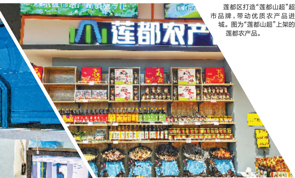
莲都区打造“莲都山超”超市品牌,带动优质农产品进城。图为“莲都山超”上架的莲都农产品。