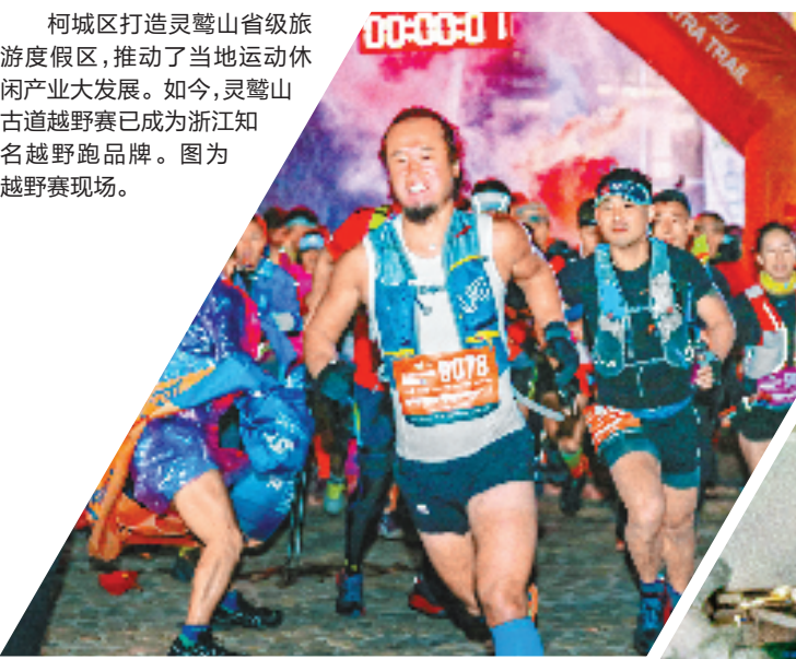
柯城区打造灵鹫山省级旅游度假区,推动了当地运动休闲产业大发展。如今,灵鹫山古道越野赛已成为浙江知名越野跑品牌。图为越野赛现场。