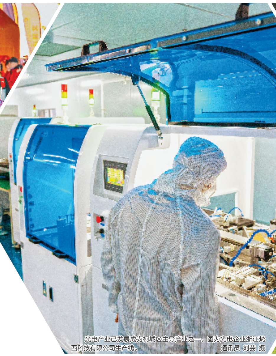
光电产业已发展成为柯城区主导产业之一。图为光电企业浙江梵西科技有限公司生产线。