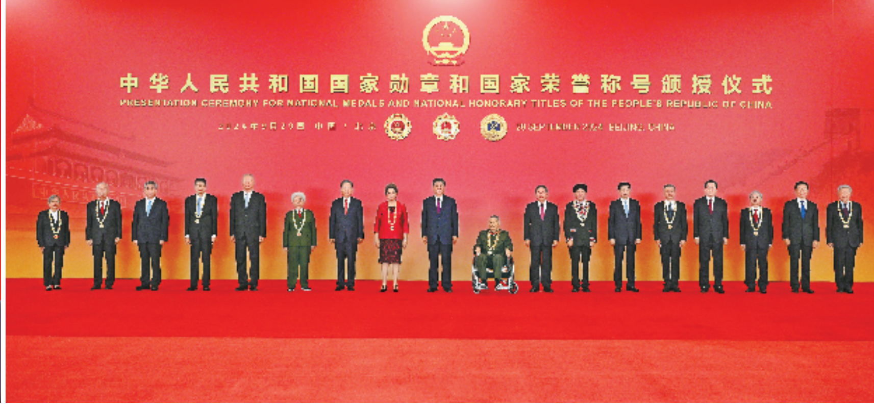
中共中央总书记、国家主席、中央军委主席习近平向国家勋章和国家荣誉称号获得者颁授勋章奖章并发表重要讲话。