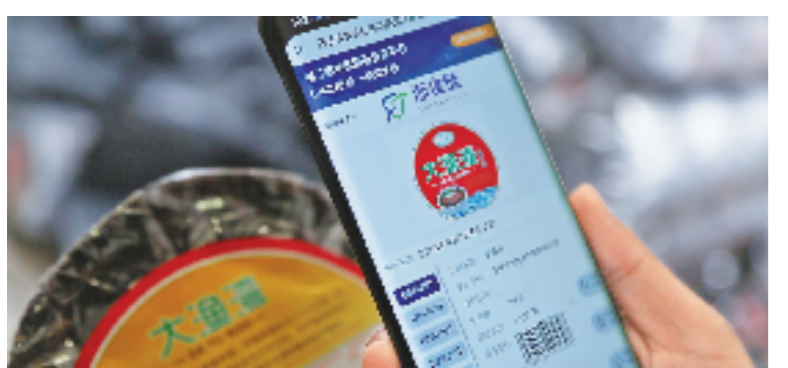
全国率先上线“浙食链”系统

2021年3月,浙江省市场监管局在全国率先上线“浙食链”,标志着我省食品安全进入了从农田(车间)到餐桌全程监管的新阶段。目前,浙江省市场监管局已构建起覆盖食品生产、销售全链条的闭环溯源管理体系。消费者只需扫一扫食品包装或门店的“浙食链”二维码,就能轻松了解食品从生产到销售的全过程。