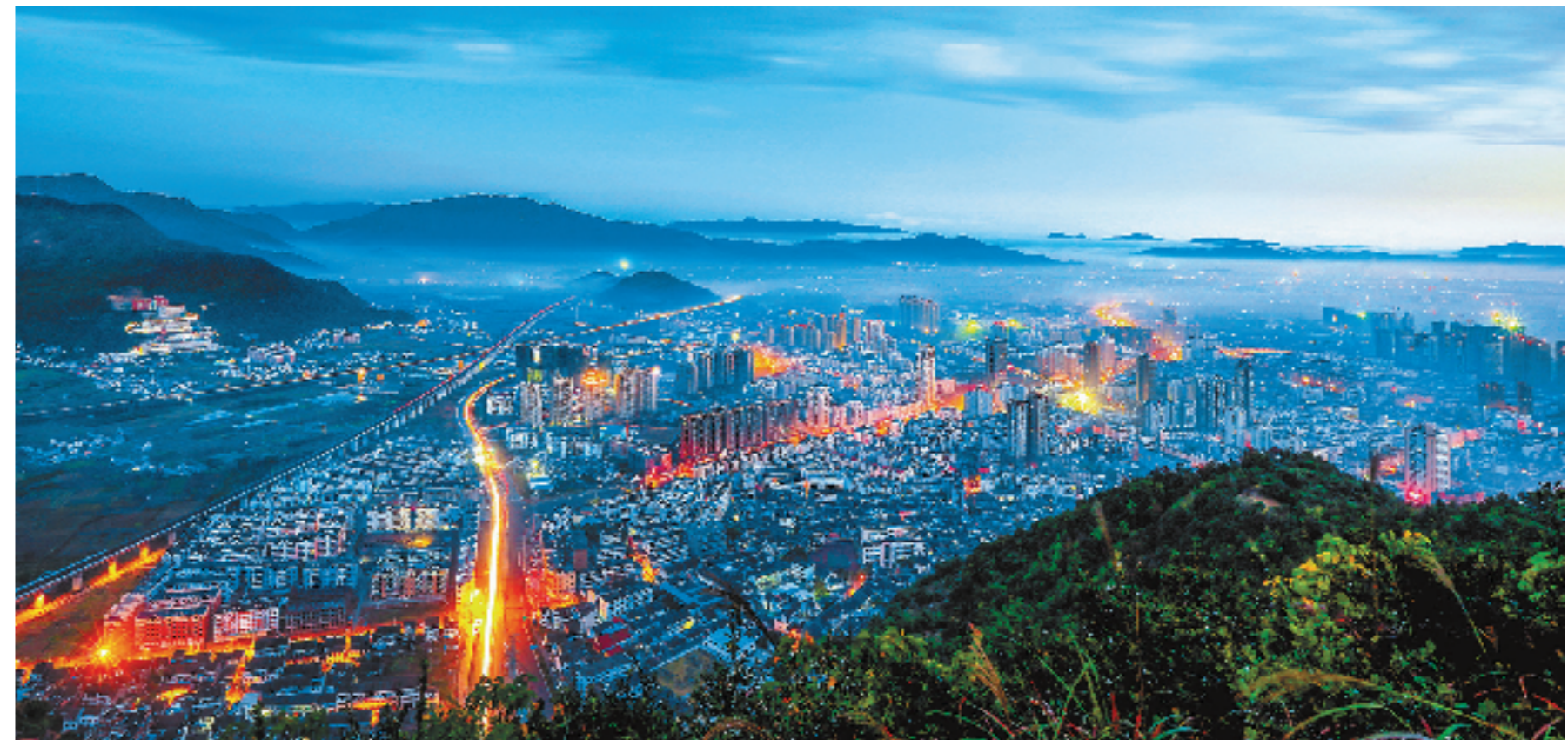
浙江是全国最早完成脱贫任务的省份。早在1997年,浙江就在全中国率先消除贫困县,并在2002年率先消除贫困乡镇。到2015年,浙江已全面消除家庭人均年收入4600元以下的绝对贫困现象。左图:1998年5月拍摄的平阳县城。右图:2024年8月,平阳最被调出“山区26县”。图为如今的平阳县夜景。