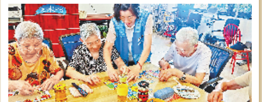
全国首部社会养老服务地方性法规

随着我国老龄化现象日益突出,高龄、失智失能、空巢老人逐年增多,社会养老服务需求日益突出。2015年3月1日,《浙江省社会养老服务促进条例》正式施行,这是全国首部由人大常委会通过的社会养老服务地方性法规。《条例》根据有关法律和我省实际制定,将社会养老服务方面的成功经验和政策措施制度化,促进我省社会养老服务健康发展。