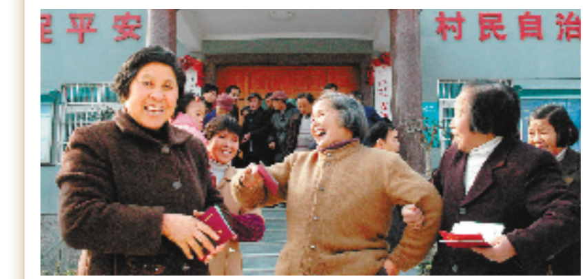
开启全国户籍制度改革先河

一纸薄薄的户口簿,曾是农村和城市之间一道难以逾越的鸿沟。1995年起,湖州以里山镇被确定为全国小城镇综合改革试点镇为契机,开启了一系列户籍管理制度改革。2013年9月30日,德清率先完成户籍制度改革试点,该县43万城乡居民统一登记为居民户口。2016年1月1日,湖州全市推出新的户籍政策和公共配套政策,结束城乡户口二元制时代,正式迈入城乡户口一元制的新时代。