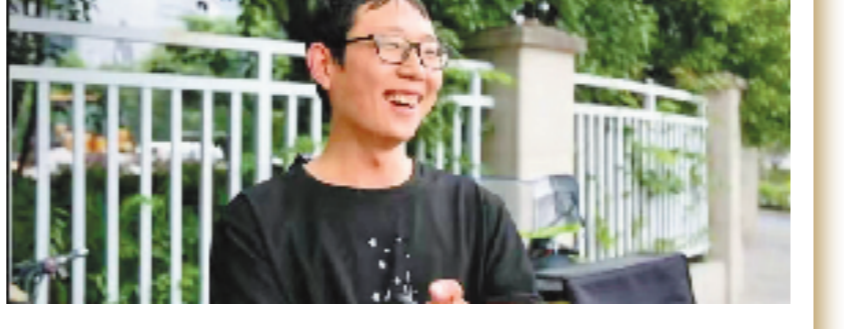
慈善组织、慈善信托资金总规模居全国第一

近年来,浙江持续围绕省委、省政府全面打造“善行浙江”的决策部署,着力构建新型慈善体系,推动构建组织化、专业化、多元化、智能化、规范化的慈善事业高质量发展新格局,积极助力共同富裕先行示范。截至2024年8月,全省登记认定的慈善组织2212家,慈善信托累计备案659单,资金总规模22.18亿元,均居全国第一。