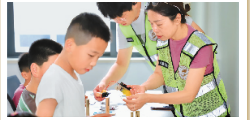
全国首个新居民事务局

2007年6月,平湖市创造性地设立了新居民事务局,这是全省乃至全国第一个专门负责流动人口服务与管理工作的常设机构。通过给予外来人员同城待遇、切实服务好外来人员等办法,促进新居民尽快融入当地生活。