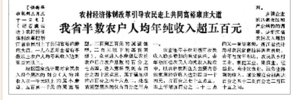
城乡居民人均可支配收入居各省区第一位