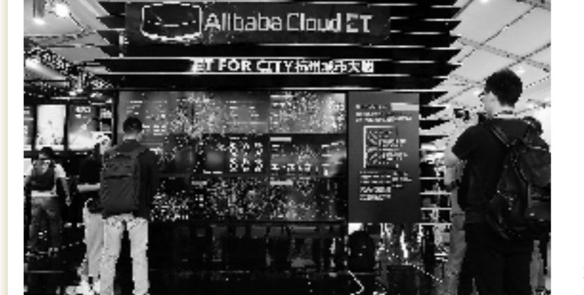
全国率先提出建设城市大脑