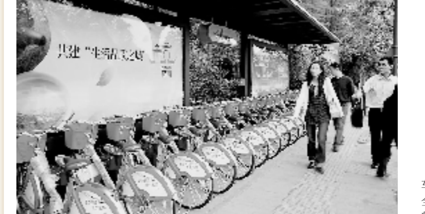
全国首推公共自行车