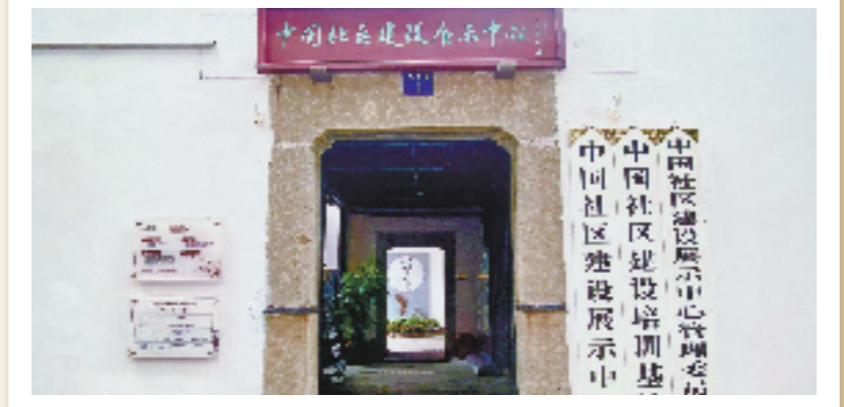
新中国首个居委会

2008年6月,民政部组织专家在全国寻访后确定,杭州上羊市街居委会是新中国首个居委会。上羊市街居委会的成立是新中国基层民主政治的一件大事,成为新中国“人民管理城市”的基层民主政治的坐标原点。