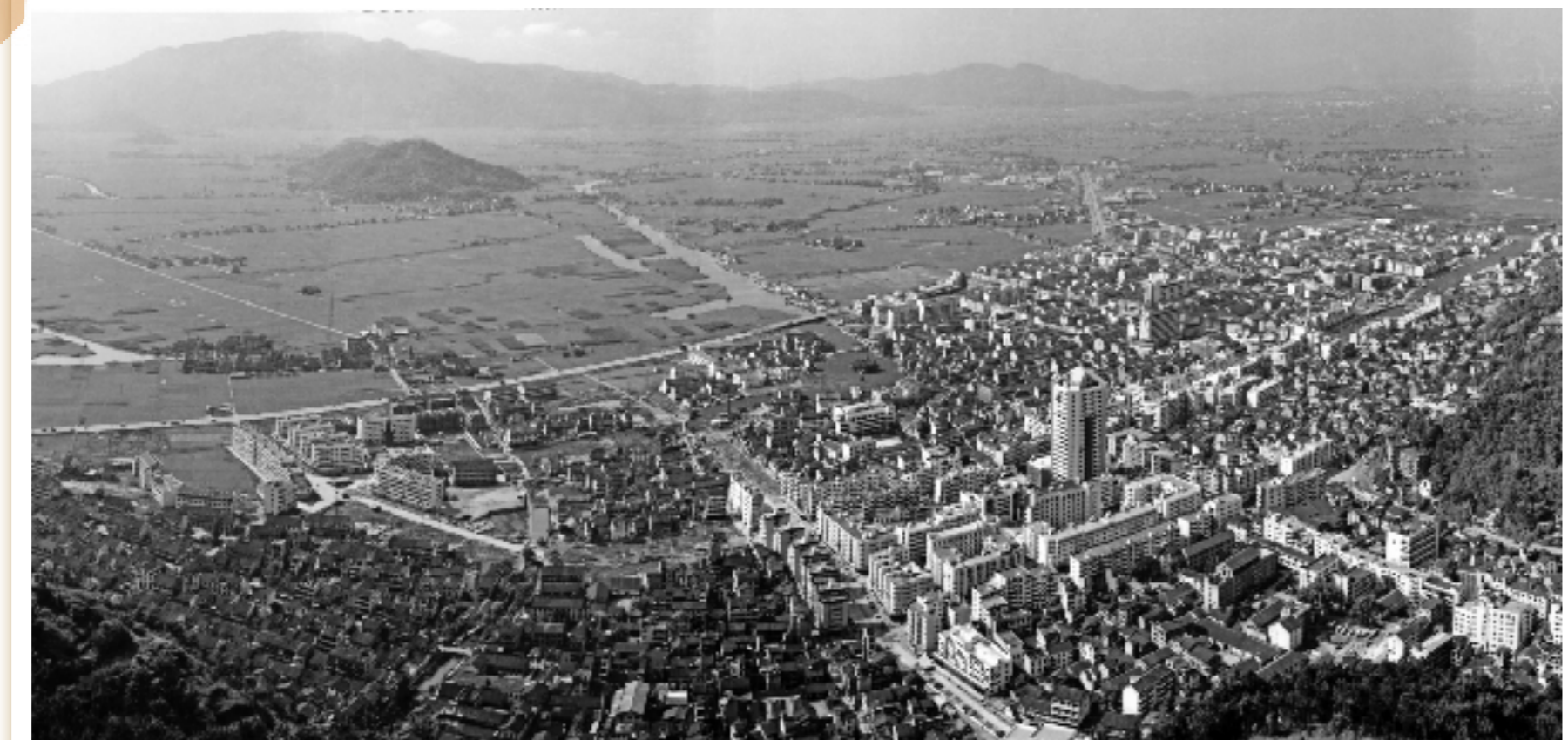
全国第一个消除贫困县的省份