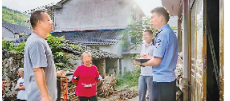
全国首个实现低保市域同标的省区

2022年12月,随着金华市将全市低保标准统一调整为每月1050元,浙江成为全国首个实现低保标准市域同标的省区,11个设区市低保标准首次全部突破每月1000元。