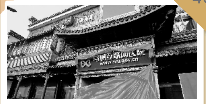
全国首家互联网医院

2015年12月7日,第二届世界互联网大会召开前夕,全国首家互联网医院在乌镇互联网创新发展综合试验区上线,并推出乌镇互联网医院官网与乌镇医院App,为全国百姓提供以复诊为核心的在线诊疗服务。通过互联网,不管是偏远山区还是发达城市,老百姓都可以方便地享受到优质医疗服务。互联网医院实现了医疗资源的优化和重组,也为基层医院通过互联网改革实现服务能力提升提供了样本。