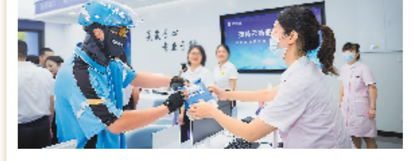
全国第一部医疗保障领域综合性地方性法规

2021年3月26日,浙江省十三届人大常委会第二十八次会议表决通过《浙江省医疗保障条例》,这是全国第一部医疗保障领域的综合性地方性法规。《条例》明确将建立统一、高效、兼容、便捷、安全的医疗保障数字化平台;实行部门间信息实时共享、医疗费用即时联网结算,实现基本医疗保险、大病保险、医疗救助等费用的一站式办理和经办事项线上办理全覆盖等。