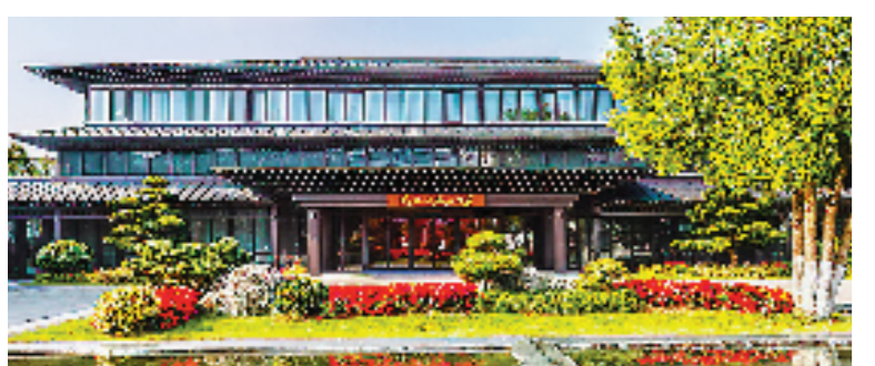
浙江干部群众首创“枫桥经验”

在1963年社会主义教育中,诸暨枫桥干部群众创造了“在党的领导下,发动和依靠群众,实现捕人少、治安好”的经验。是年11月,毛泽东主席亲笔批示:“各地仿效,经过试点,推广去做。”2003年,时任浙江省委书记的习近平同志明确要求充分珍惜、大力推广,“不断创新枫桥经验”。党的十八大以来,习近平总书记多次作出重要指示,要求在社会基层坚持和发展新时代“枫桥经验”。“枫桥经验”已成为浙江的一张“金名片”。