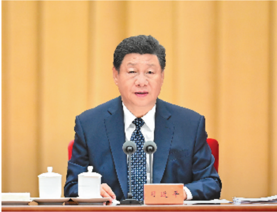
9月27日,全国民族团结进步表彰大会在北京举行。中共中央总书记、国家主席、中央军委主席习近平出席大会并发表重要讲话。

在热烈的掌声中,习近平发表重要讲话。他首先代表党中央和国务院向受到表彰的模范集体和个人表示热烈祝贺,向民族工作战线的同志们和关心支持民族团结进步事业的各方面人士表示