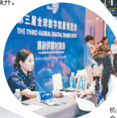
第三届数贸会前夕，杭州举办展前供需对接会。