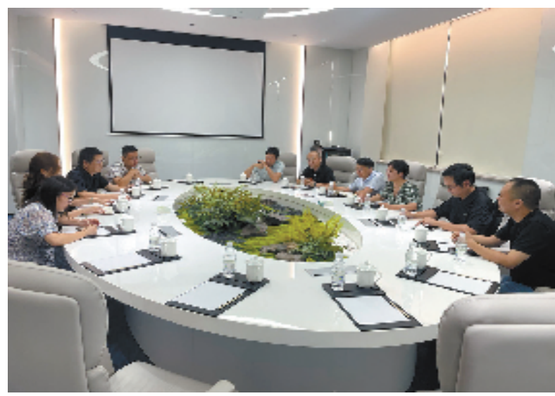
三界镇政府为企业解决问题

不久前,嵊州市下王镇举行了一场特别的驻村指导员“民情大比武”活动。活动中,9名90后驻村指导员走到台前,围绕“助力提升村庄治理水平”“我的驻村故事”等主题进行交流,从帮助村民学习技能、丰富精神生活,到为村子的文化旅游项目出谋划策,吸引更多流量和游客,年轻人分享了一个个故事,回顾和村庄共同成长