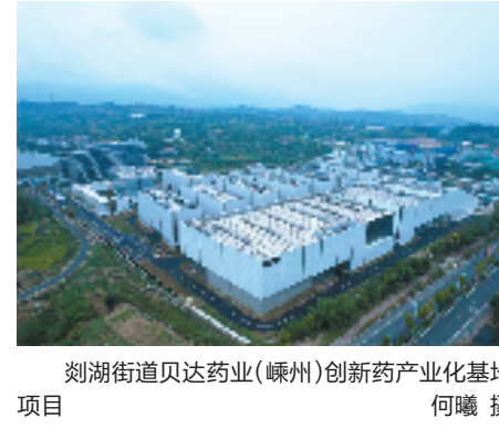
剡湖街道贝达药业(嵊州)创新药产业化基地项目