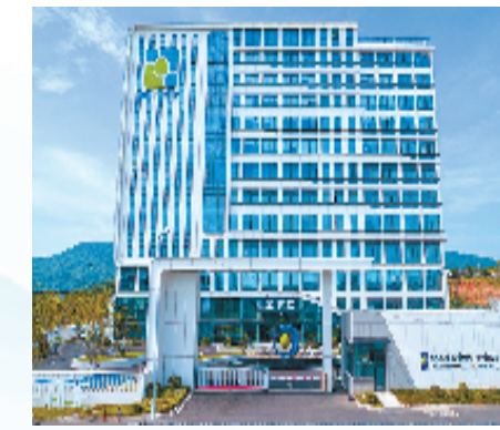
浙江再航生物股份有限公司

域在后台一览无遗,实现全流程监管,而通过“电子食安身份证”,食材从哪儿来,检测结果什么样,这些信息全部公开透明,一图集成,公众在手机上就能直接查阅,便捷又安心。