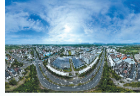
嵊州市城北化工园区