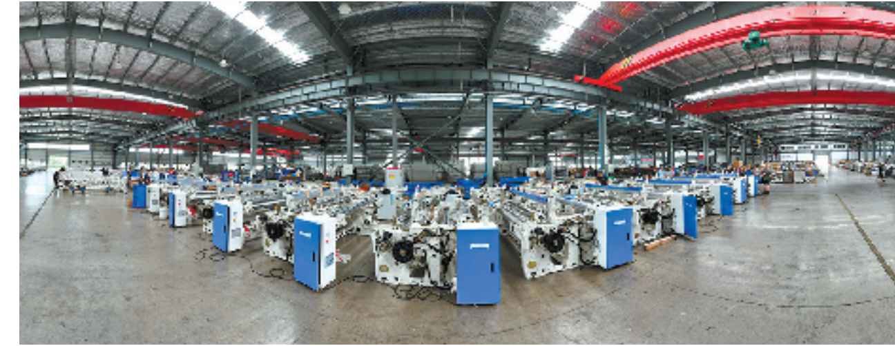
黄泽镇星耀纺机车间

近年来,改革的号角在剡溪两岸回荡,奏响激昂的时代强音,嵊州正奋楫向前,提速打造浙中重要增长极,书写动人的新篇章。