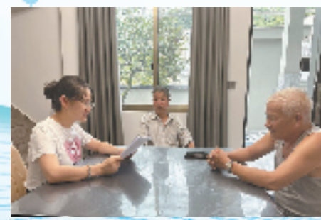
下王镇石溪村驻村指导员为村民讲解民宿帮扶政策