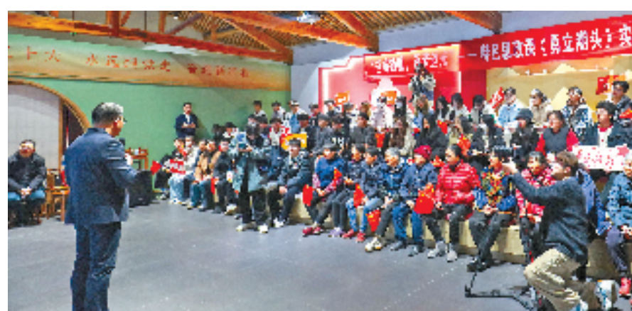
宁波职业技术学院师生在走马塘村举行“奋楫扬帆 逐梦追光”特色思政课《勇立潮头》实践教学

小学思政教育一体化建设，着力打造全省思想政治教育的市域样板，为推进宁波教育强市建设贡献“思政”力量。