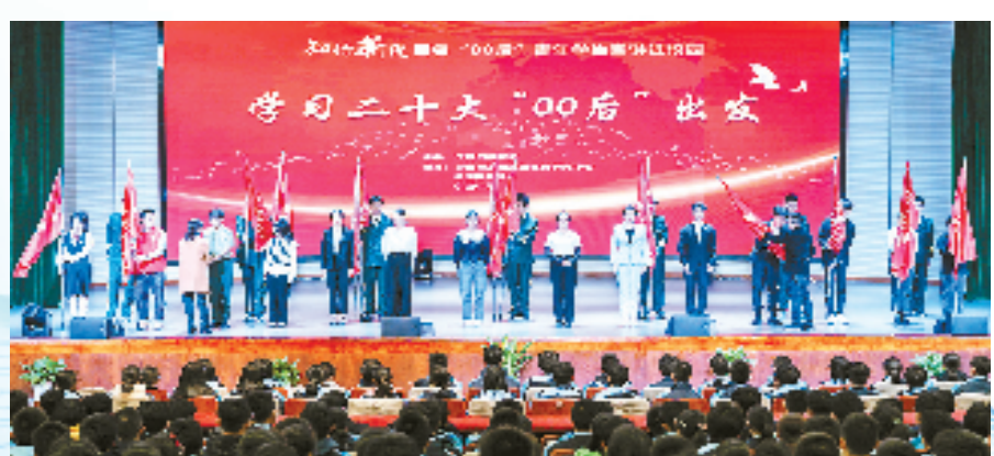
“知行新说”百名“00后”青年学生宣讲进校园活动启动仪式