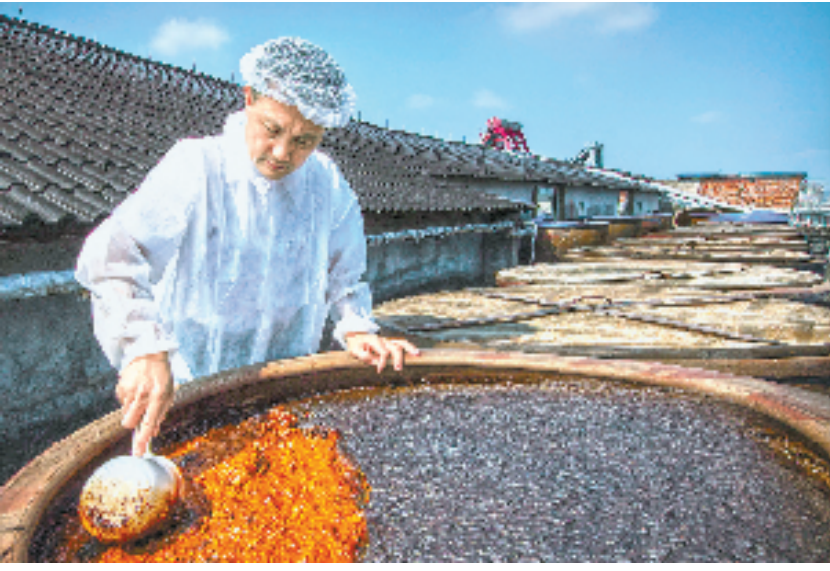
丽水市鱼跃酿造食品有限公司的酱缸翻酱工艺场景。

中央金融工作会议将普惠金融列为“五篇大文章”之一。如何保护这些老字号品牌,做好非遗传承和焕新?农行浙江省分行立足服务“三农”使命担当,在关注社会经济发展的同时,积极投身于非遗文化的传承与保护,不断加大信贷资金投放力度,通过创新金融产品和服务支持历史经典产业塑造新辉煌。