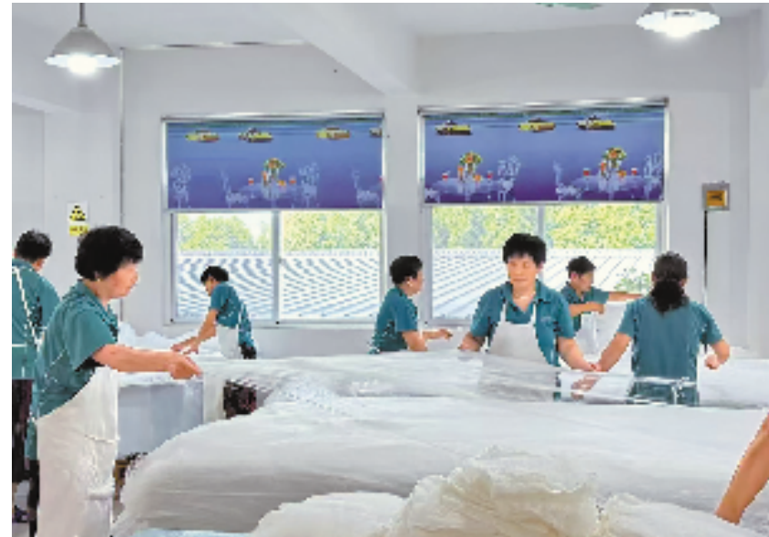
浙江蚕缘家纺股份有限公司的蚕娘们正在拉丝制作蚕丝被。

在农行人的守护下,有着深厚文化底蕴的浙江正在兴起一个个非遗文化特色产业集群。这些产业集群在激荡起区域经济发展的层层浪花、带动产业腾飞和百姓增收的同时,成为新时代人文经济的一抹鲜亮色彩。