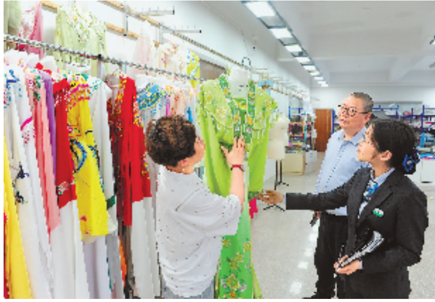
农行绍兴嵊州市临城支行客户经理走访嵊州美春戏具生产车间。

越剧这一非遗文化的薪火相传,来自于戏迷源源不断的热爱。农行和美君越剧团的结缘并非偶然。正因为常跟东王村里民间艺人打交道,深入研究过这一发展模式,才使得农行能够第一时间获知他们的资金需求。“民营剧团前期资金不多,演员多是50岁左右的村嫂,但她们都有一把好嗓子,唱戏也很有热情,活动很受欢迎,有发展空间,