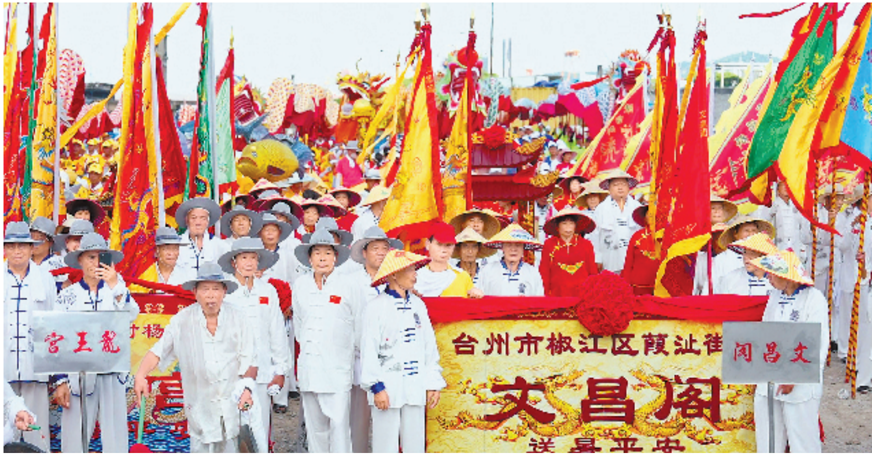
农行信贷支持台州椒江“送大暑船”非遗文化。