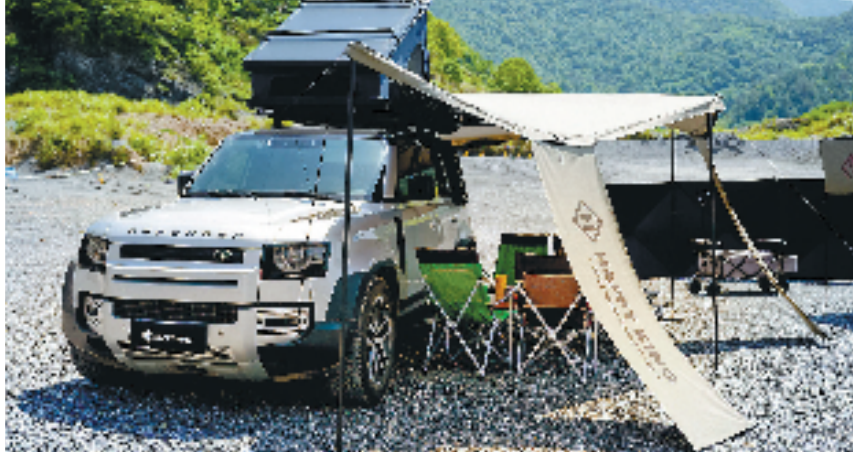
中国(金华)国际户外露营装备沉浸体验展上,金华企业展出的车顶帐篷。