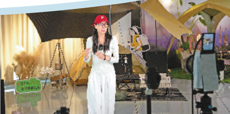
原始人公司展厅,主播正在直播销售各类户外运动产品。