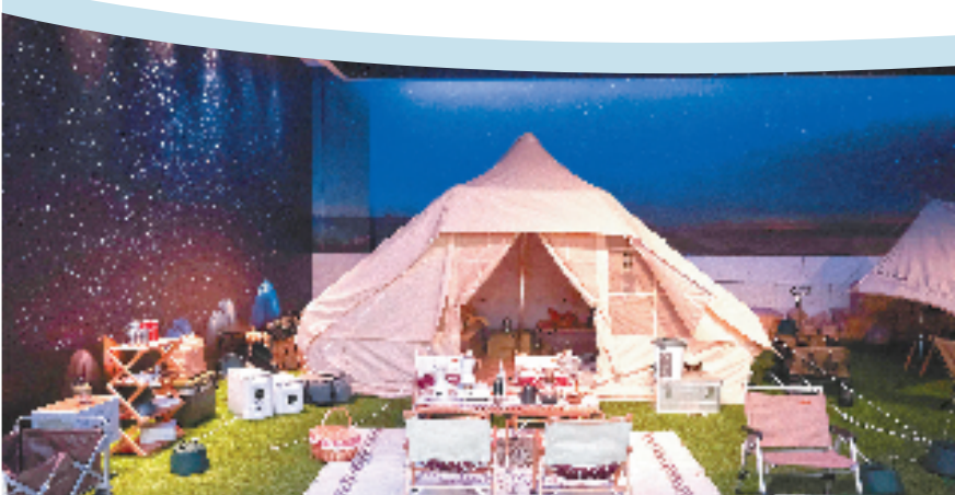
圣雪公司内的户外生活体验馆,搭建了各种主题的露营场景。