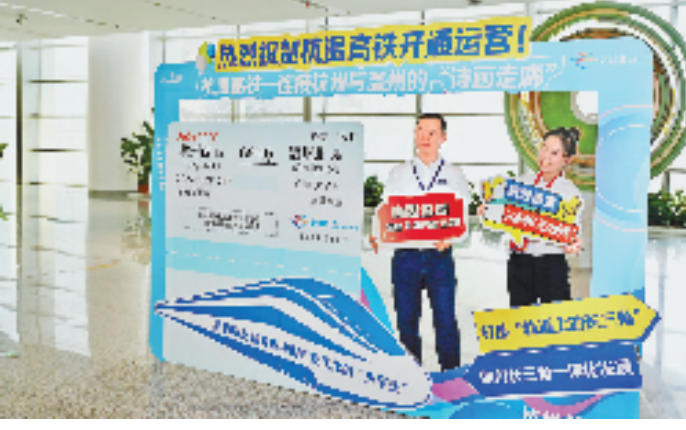
乘坐首发列车的乘客在杭州西站打卡。