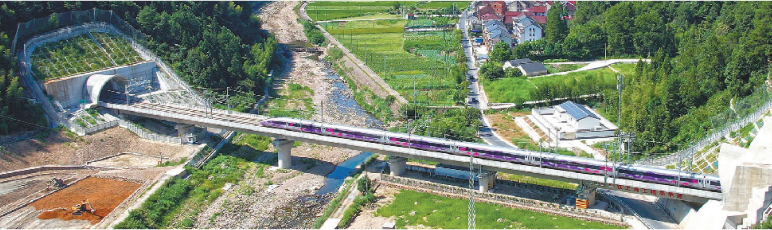
9月6日,杭温高铁首发列车穿越桐庐和浦江之间长达十余公里的木匪岭隧道。