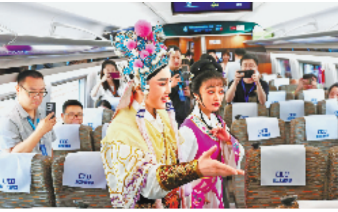
越剧演员在首发列车车厢内表演越剧选段。

穿梭在连绵起伏的群山间,飞速行驶的列车犹如一条银线,串起杭温高铁线上的期待与憧憬。9月6日9时许,两趟首发列车同时从杭州西站和温州北站出发,穿山越岭,分别驶向温州和杭州,这也意味着浙江人期盼已久的杭温高铁正式开通运营。