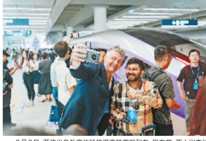
9月6日,两位义乌外商体验杭温高铁首发列车,发车前,两人兴奋地在列车前合影。

杭温高铁正线全长276公里,设计时速350公里。全线设桐庐东、浦江、义乌、横店、磐安、仙居、楠溪江、温州北、温州南9座车站。开通运营初期,铁路部门将按照日常线、高峰线安排旅客列车开行,每日开行动车组列车最高达38列,杭州西至温州北最快87分钟就可到达。