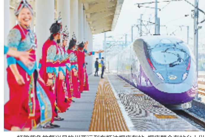
虹韵紫色的复兴号杭州亚运列车抵达桐庐东站,桐庐群众在站台上以热烈的“畲族迎宾舞”迎接进站列车和旅客。