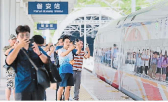
9月6日,杭温高铁磐安站房启用。附近居民赶到磐安站拍照打卡留念,见证这一激动人心的时刻。