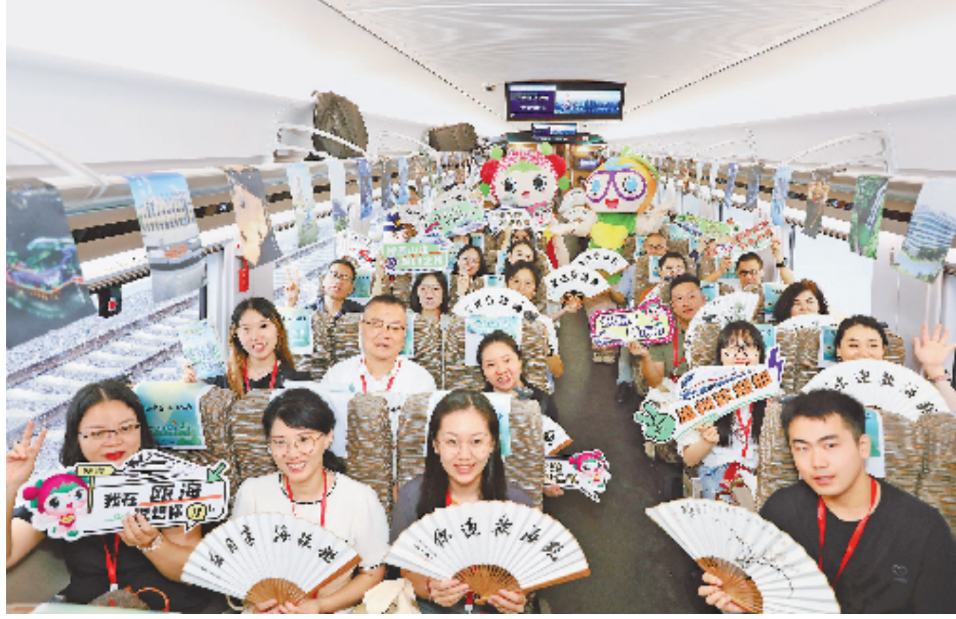
在温州瓯海文旅主题车厢内,吉祥物“瓯哥海妹”与乘客们亲切互动,发放书画扇纪念品,欢迎大家来温州做客。