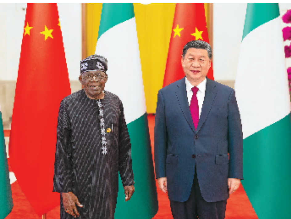
9月3日下午,国家主席习近平在北京人民大会堂同来华出席中非合作论坛北京峰会并进行国事访问的尼日利亚总统提努布举行会谈。

■关于中津关系 双方要秉持友好初心,构建以政治、经贸、安全、人文、国际协作为支柱的“五星铁杆”合作架构,携手构建高水平中津命运共同体