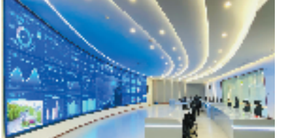
青莲食品智慧驾驶舱

头乌、金华火腿全产业链高质量发展各10条措施,“真金白银”擦亮地方土特产名片;嘉兴市印发《关于支持嘉兴黑猪全产业链高质量发展十条政策措施》通知,从土猪的全生命周期出发,从提量、提质、提效等方面精准施策,促进浙江土猪产业链向纵深发展、价值链向高端攀升;宁海县推出《关于支持岔路黑猪全产业链高质量发展的若干政策(试行)》,也打响了地方土猪品牌攻坚战、品质提升战、品种升值战。