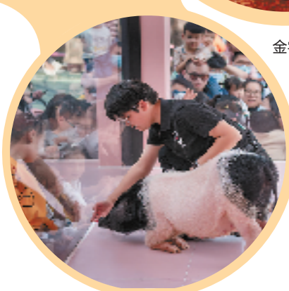
熊猫猪乐园“猪猪表演”