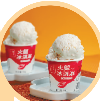
金字火腿-火腿冰淇淋