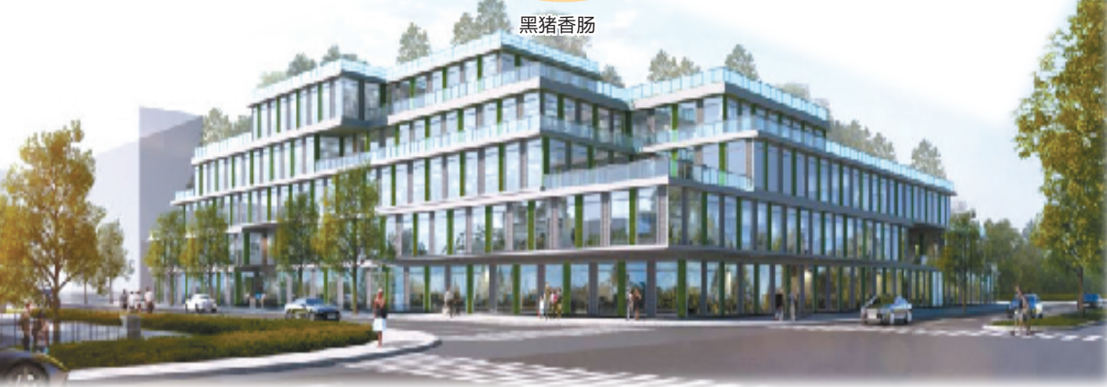
金华市两头乌繁育中心(概念图)