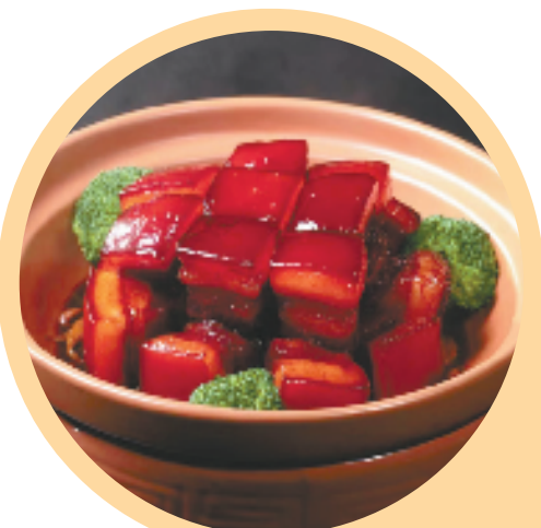
金华两头乌东坡肉

如金华市出台《关于支持金华猪(金华两头乌)和金华火腿全产业链高质量发展的若干政策(试行)》,包含支持金华两