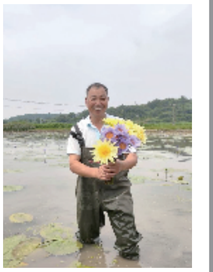
睡莲产业如火如荼

在这里,学员也可以充当教员,把基层一线工作的大课堂融入干部共同交流提升的小讲坛,让大家在基层工作的火热实践中随时充电。此外,还推出“青锋小将”评选活动,树立实践、实干、实绩的鲜明导向,释放正向激励的“波纹效应”,与此同时,制定了一系列负向减分标准,让“躺平者”无所遁形,激发反向约束的“鲶鱼效应”。