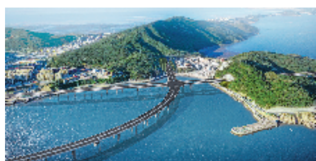
甬莞高速洞头支线效果图。