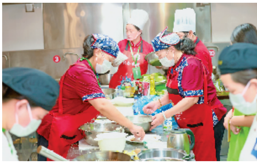
“乡村厨娘”技能大比武现场。