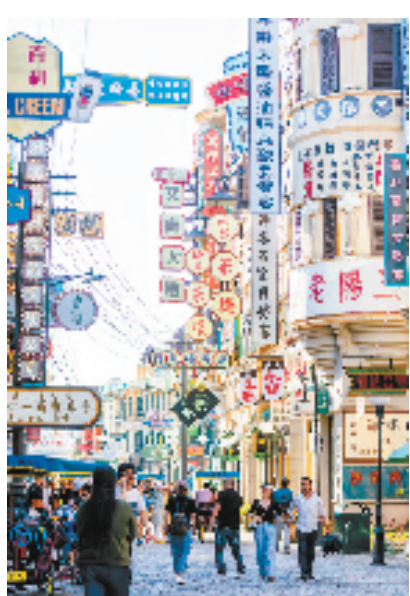
明清宫苑拍摄基地

时光拉回10年前,彼时的横店影视城,优质拍摄场景较少,能承载的影视题材类型较为单一。此外,从全国层面看,各地影视基地同质化竞争激烈,横店影视文化产业发展面临“成长的烦恼”。