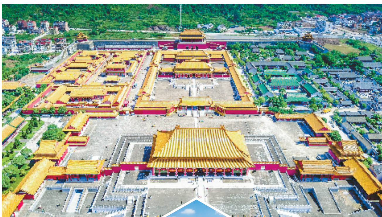
明清宫苑拍摄基地