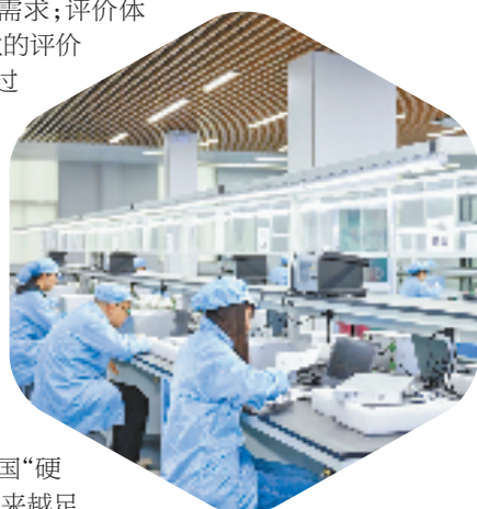
农行浙江省分行金融支持频频科技企业。

生态服务“新”,搭建新的生态服务模式,实现“融资+融智”“产业+科技”的赋能式服务。为科技创新添动力,相信随着科技金融生态圈的日益完善,强大,中国“硬科技”的底色也将越来越足。