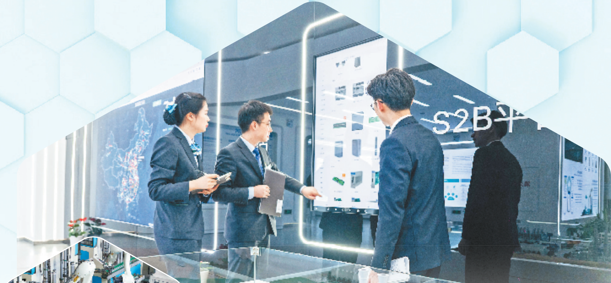
农行浙江省分行工作人员常态化走访高新科技企业,对接融资需求。