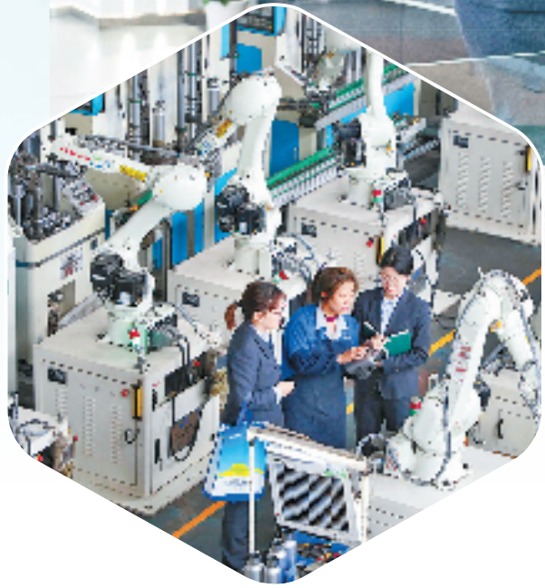
农行浙江省分行工作人员走访智能工厂,在智能车间了解产品生产情况。