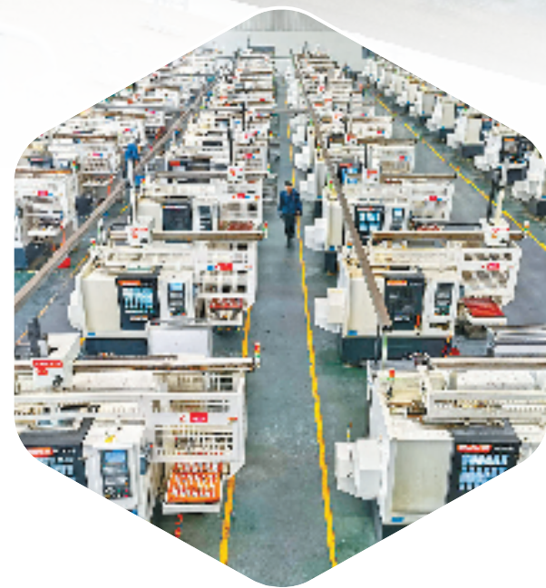
农行浙江省分行金融支持温州汽配行业龙头企业发展壮大。