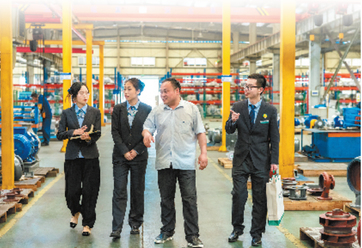
农行浙江省分行工作人员走访科创企业了解生产情况。