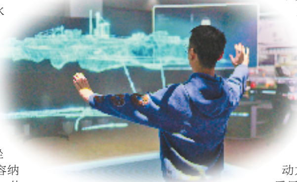
农行杭州科创支行金融支持裸3D设备研发制造企业发展。

创新是发展的第一动力,金融是科技创新的助推器。“我们将继续做好科技金融这篇大文章,不断完善金融支持创新体系,以可持续、多层次、广覆盖的科技金融服务,推动新质生产力加快形成,激活经济发展的活力动力,助力金融高质量发展。”农行浙江省分行有关负责人表示。