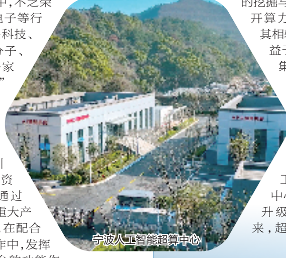
宁波人工智能超算中心

眼下，一张以“母基金+区域基金+行业基金”为核心，涵盖天使投资、风险投资、私募股权到战略投资的全生命周期基金谱系正不断扩容提质。截至目前，通商基金在管和参与的母子基金累计达到54支，协议管理总规模近900亿元，实缴规模超300亿元，已成为宁波规模最大的股权投资机构。