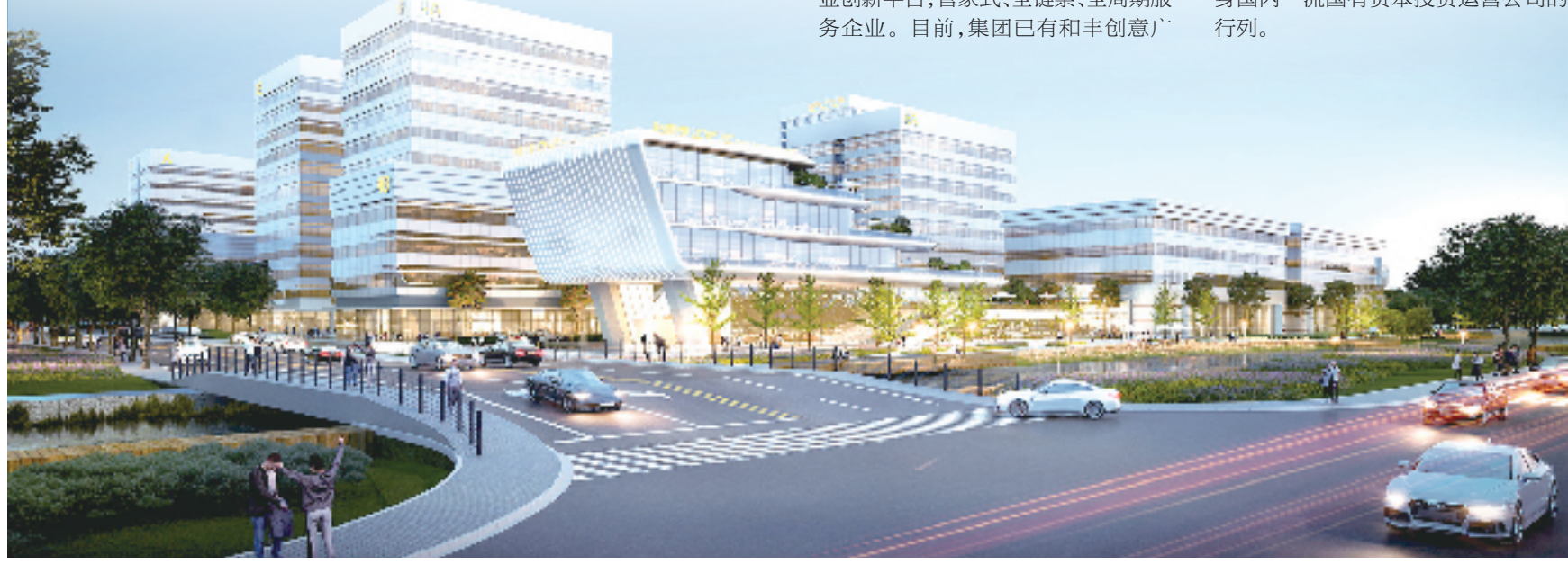
胜遇数字经济产业园效果图

“下一步，我们将继续当好宁波国有资本投资运营的‘主力军’，夯实经济运行的‘压舱石’，助推宁波激活产业新动能、释放经济新活力、培育发展新质生产力。”宁波通商控股集团有限公司负责人表示，集团力争到2026年末，跻身国内一流国有资本投资运营公司的行列。