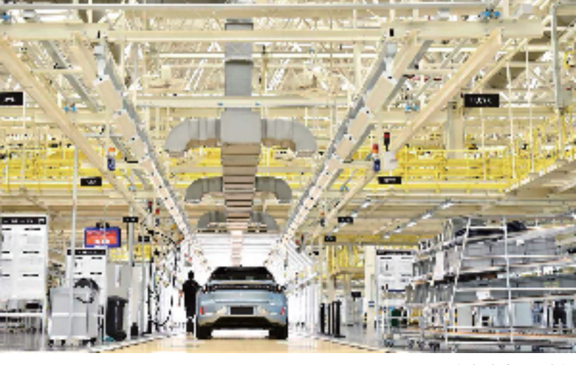
极氪未来工厂车间

今年上半年，集团有效投资达83.1亿元，战略新兴产业投资占比82%；路特斯科技、极氪汽车先后登陆纳斯达克和纽交所；完成全市首个基于公共数据授权开发的数据资产入表；鲲鹏生态产业园加速“筑巢引凤”抢滩未来产业……这些都是通商控股集团坚持项目投资、平台建设“两手抓”，为宁波制造提供强支撑和向“新”力的生动实践。