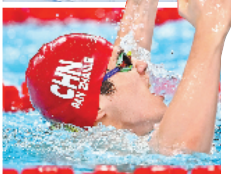
潘展乐在夺冠后庆祝。新华社记者 王鹏 摄

本报讯 据央视报道,当地时间8月4日,巴黎奥运会游泳男子4×100米混合泳接力,由徐嘉余、覃海洋、孙佳俊、潘展乐组成的中国队夺得金牌,也打破美国队超过40年的金牌垄断。而美国队此前在该项目上已经取得十连冠。