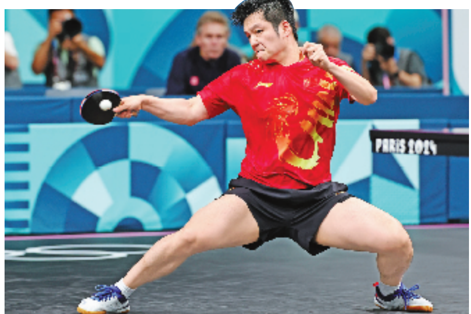
图为樊振东在比赛中。

决赛首局,樊振东略显慢热,莫雷高德进攻犀利,以11:7获胜。第二局,莫雷高德9:8领先,樊振东追回1分,之后又连得两分,将大比分扳平。第三局,双方多次进入相持,莫雷高德从3:7追至6:7时,中国队教练王皓请求暂停,樊振东最终以11: