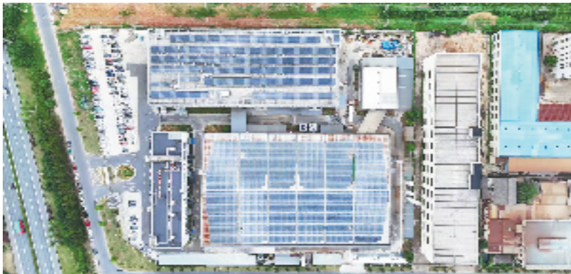
长合区工商业储能项目

长合区工商业储能项目建设的背后,是沪浙两地企业的强强联手。今年以来,长合区紧扣“高质量”和“一体化”两个关键词,紧紧围绕打造长三角绿色智造新高地和跨省域产业合作新典范目标定位,全面深度融入长三角一体化战略。“接下来,长合区将以此项目为起点,不断促进绿色智造产业集群的形成,为长三角一体化高质量发展注入更强劲的绿色动能。”长合区管委会相关负责人说。