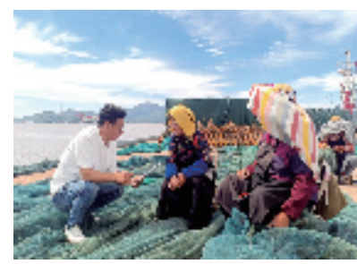
普陀区纪委监委紧盯伏季休渔节点,以“下沉式”监督的方式,深入传统渔业产区开展一线调研。

船开捕关口,督促渔政船、护渔船在全区各主要出海口设卡检查,严防开捕渔船‘抢跑道’或非开捕渔船提前违规出海生产,切实保障渔业经济的可持续发展。”普陀区纪委监委相关负责人表示。