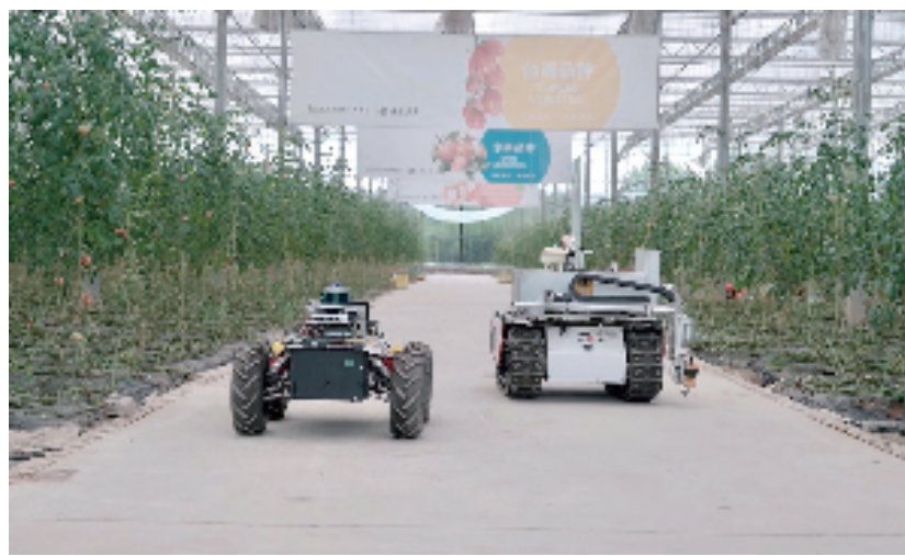
玻璃温室内的全场景数据采集机器人正在作业

育种是农业核心技术之一。过去8年,浙江道济农业集团有限公司(简称道济农业)年均试种逾千种番茄,在不同季节、不同地域观察、记录这些作物的生长表现,最终筛选出“综合性能”优异的新品种“嘉红100”。