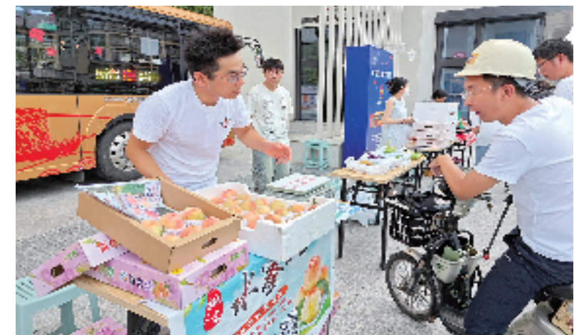
“幸福101夜市”在南湖区南湖街道南湖社区开张

今年以来,上溪镇以“上溪荟才·共创未来”产才融合项目为主题,加大与各大高校的合作力度,已开展技能人才培养、交流两场,覆盖300余人,培训引进专业技能人才200人左右,建立安徽文达信息工程学院、浙江省机电技师学院大学生实习实训基地。与此同时,积极落实一站式贴心服务,相继解决长新传动公司厂房拓展、非攻机械用电短缺等人才企业问题4个,帮助企业稳定生产;不断完善党建人才综合服务职能,谋划镇级人才驿站建设,目前已开展青年人才活动4场。