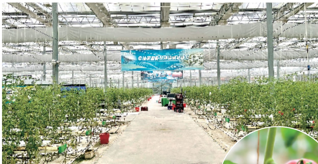
选育“嘉红100”的5G无人农场

景数据采集机器人,负责检测、收集各类环境数据。例如,它自带的“探针”装置,扎入土壤几秒钟,就能检测出土壤中氮、磷、钾等元素的含量。