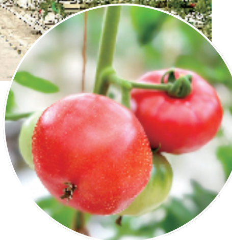
逐渐成熟的“嘉红100”

为此,去年12月道济农业打造的番茄品牌“CWE番”入驻拼多多,主销“嘉红100”番茄。“过去,我们更多面对的是浙江本地市场,而接入拼多多后,这个全新品种才彻底掀起了‘红盖头’,直面全国消费者。”李斌说。“嘉红100”的知名度不高,但均价