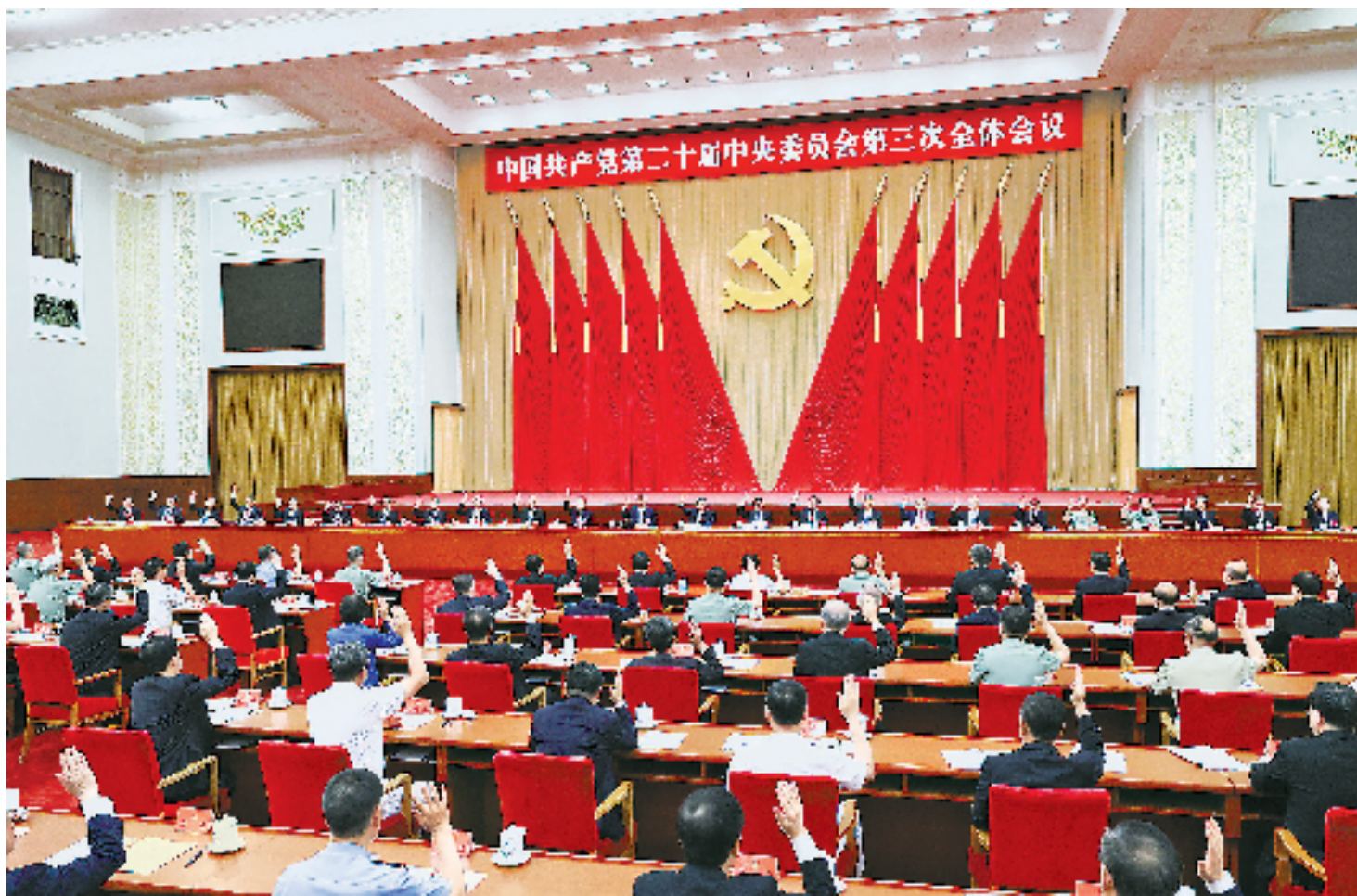
中国共产党第二十届中央委员会第三次全体会议,于2024年7月15日至18日在北京举行。中央委员会总书记习近平作重要讲话。